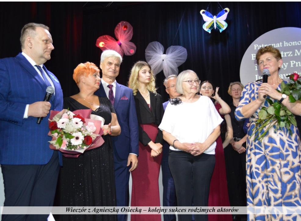
Wieczór z Agnieszką Osiecką – kolejny sukces rodzinnych aktorów

Twórczość Agnieszki Osieckiej jest wdzięcznym i często podejmowanym tematem dla artystów. Zmarła w 1997 roku poetka, a przede wszystkim autorka tekstów piosenek pozostawiła bogaty repertuar. Pisała przecież dla wielu znanych artystów. Zaprezentowano utwory nie tylko te najpopularniejsze, ale też gros mniej znanych. „Niech żyje bal”, „Deszcze niespokojne”, „Uciekaj moje serce”, „Rozmowa poety z komornikiem”, „Wariatka tańczy” – to tylko niektóre. Wieczór w wykonaniu naszych lokalnych artystów zainspirował i wzruszył publiczność. Międzypokoleniowa grupa z niezwykłą starannością odzwierciedliła oryginalny charakter utworów Osieckiej.