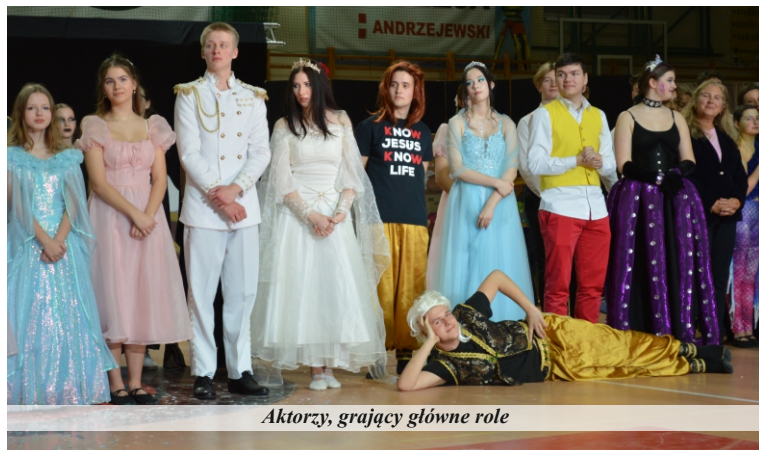
Aktorzy, grający główne role

„Mała Syrenka” była wystawiona pięciokrotnie między 12, a 16 lutego. Za każdym razem hala widowisko-sportowa w Pniewach wypełniona była po brzegi. Czekamy na kolejne projekty. Tylko czy ta hala to wszystko ogarnie?