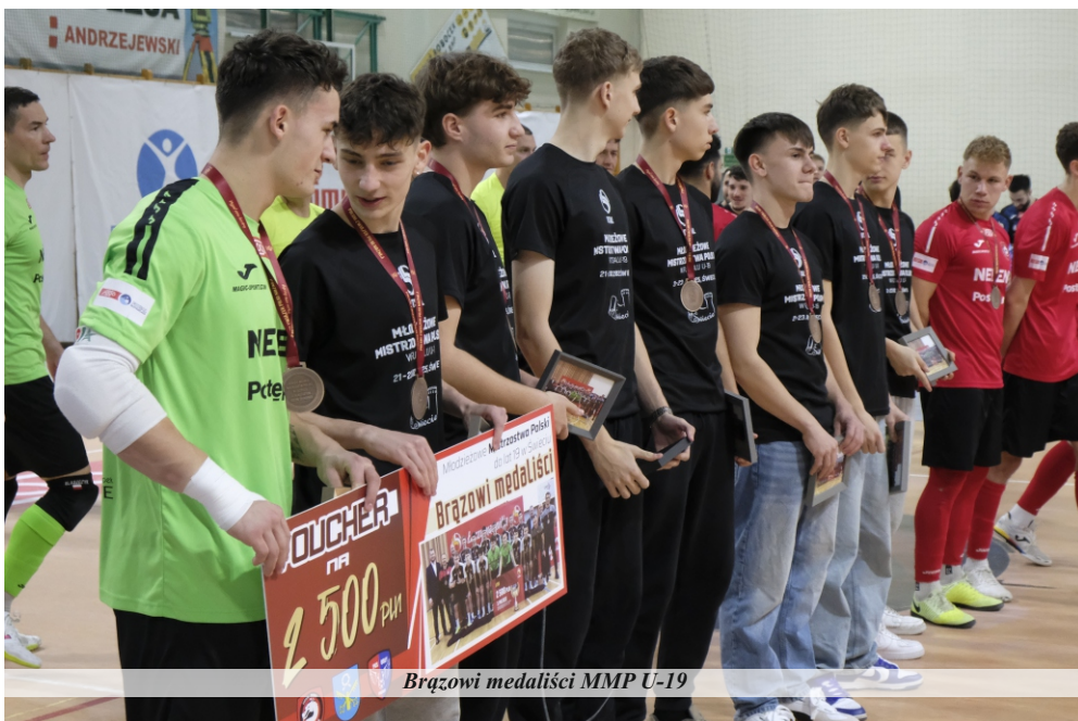
Brązowi medaliści MMP U-19