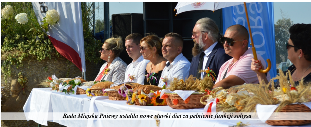
Rada Miejska Pniewy ustaliła nowe stawki diet za pełnienie funkcji sołtysa

W ostatnim punkcie obrad przyjęto uchwałę w sprawie ustalenia diet dla sołtysów. Miesięczną dietę dla sołtysów w gminie Pniewy ustalono na poziomie 44% diety należnej radnemu Rady Miejskiej Pniewy tj. 550 zł. Dieta umniejszana będzie proporcjonalnie do długości okresu przez jaki sołtys nie wykonywał swojej funkcji, bez względu na przyczynę niemożności jej wykonywania. Sołtys zobowiązany jest do bezzwłocznego informowania burmistrza o braku wykonywania czynności związanych z jego funkcją. Dieta ulega obniżeniu o 5% za każdorazową nieobecność sołtysa na naradzie sołtysów bądź szkoleniu sołtysów organizowanych przez burmistrza.