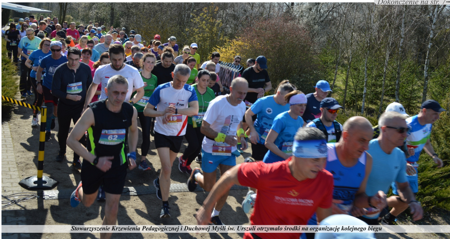
Stowarzyszenie Krzewienia Pedagogicznej i Duchowej Myśli św. Urszuli otrzymało środki na organizację kolejnego biegu