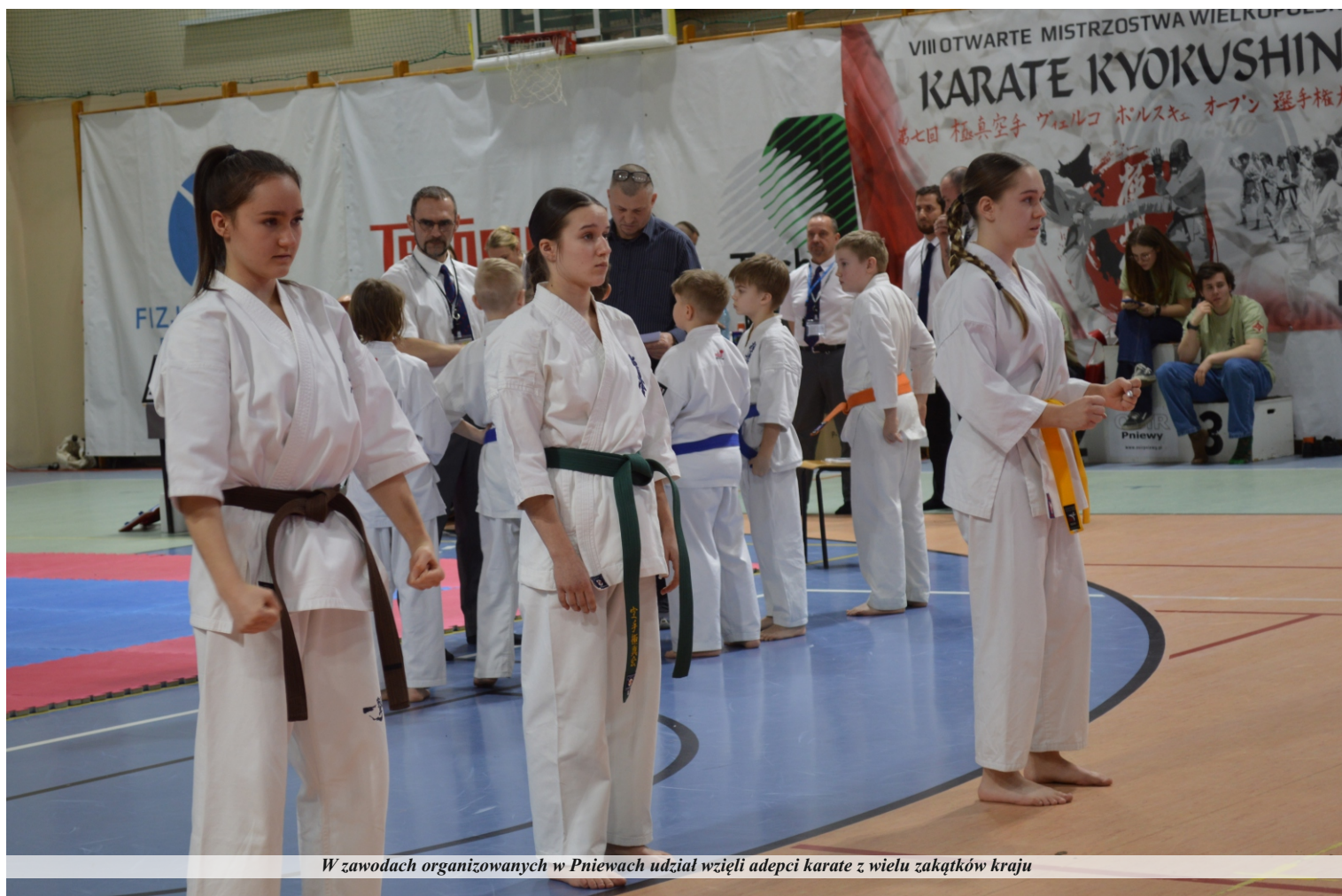
W zawodach organizowanych w Pniewach udział wzięli adepci karate z wielu zakątków kraju

Sportowa rywalizacja była dla zawodników UKS Kyokushin Karate Pniewy cennym doświadczeniem i doskonałą okazją do sprawdzenia swoich umiejętności na tle innych zawodników z kraju. Klub z Pniew może być dumny ze swoich zawodników, ponieważ systematycznie rośnie liczebność kadry zawodniczej, a także umiejętności i doświadczenie.