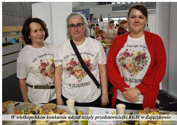
W wielkopolskim konkursie udział wzięły przedstawicielki KGW w Zajązkowie

Tego dnia na konkursowych stołach dominowały babki, mazurki, paschy, faszzerowane jajka, serniki czy sałatki. Ponadto przygotowano mnóstwo kolorowych potraw