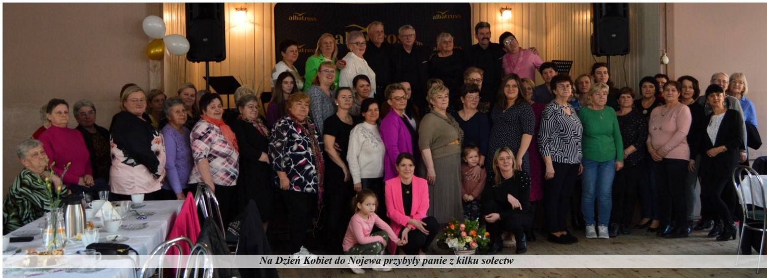
Na Dzień Kobiet do Nojewa przybyły panie z kilku sołectw