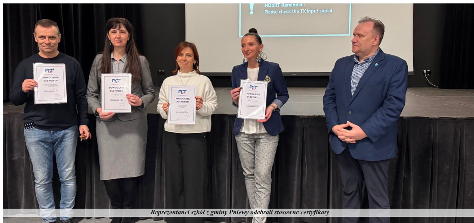
Reprezentanci szkół z gminy Pniewy odebrali stosowne certyfikaty

PaT to skrót ogólnopolskiego programu edukacyjno-profilaktycznego Komendy Głównej Policji, realizowanego od 2006 roku. PaTport to najprostsze rozwiązanie organizacyjne dla tych osób, które chcą się aktywnie włączyć w działalność profilaktyczną. Funkcjonuje w oparciu o działania metodą twórczej profilaktyki rówieśniczej.