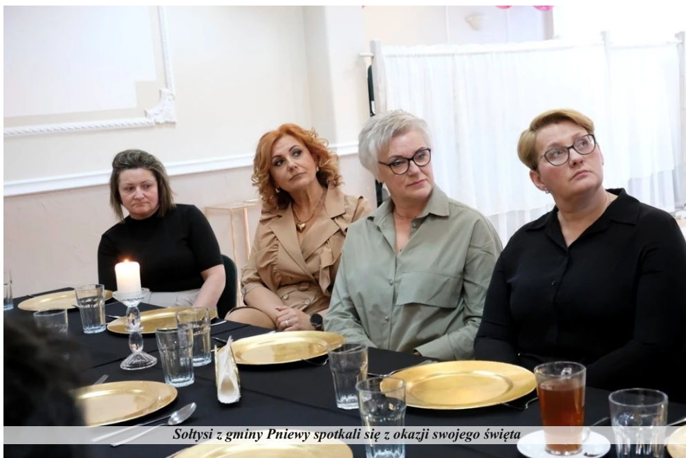
Sołtysi z gminy Pniewy spotkali się z okazji swojego święta

Burmistrz w swoim wystąpieniu podziękował wszystkim sołtysom za ich codzienną pracę na rzecz mieszkańców i rozwój sołectw. Podkreślił, że ich zaangażowanie, troska o dobro wspólne oraz umiejętność współpracy przyczyniają się do poprawy jakości życia w gminie. Przewodniczący Rady Miejskiej również wyraził swoje uznanie dla sołtysów, podkreślając, że są oni istotnym ogniwem w systemie samorządowym, łączącym mieszkańców z władzami gminy. Podczas spotkania