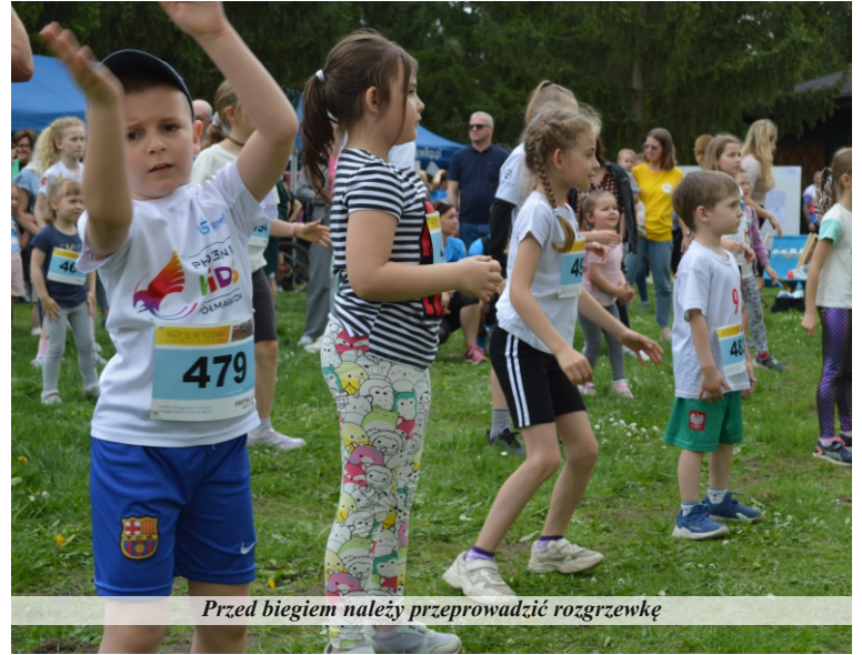
Przed biegiem należy przeprowadzić rozgrzewkę