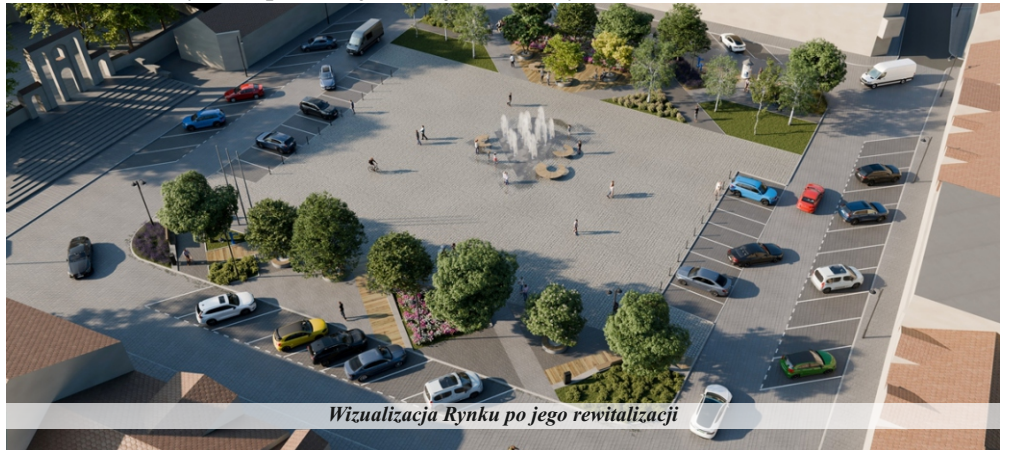
Wizualizacja Rynku po jego rewitalizacji