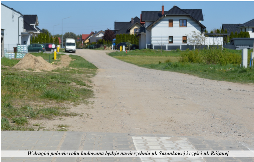
W drugiej połowie roku budowana będzie nawierzchnia ul. Sasankowej i części ul. Różanej

Inwestycja obejmuje budowę dróg, ulic Sasankowej i części Różanej oraz uzupełnienie oświetlenia drogowego na ul. Różanej i Lawendowej w Pniewach. W ramach prac przy budowie ulic należy wykonać między innymi mechaniczne profilowanie i zagęszczenie podłoża, podbudowę z betonu, ułożenie obrzeży betonowych, oporników betonowych wtapianych, krawężników betonowych, w tym najazdowych, ścieków z dwóch rzędów