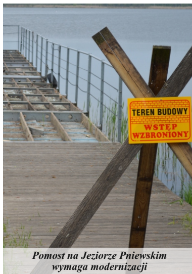
Pomost na Jeziorze Pniewskim wymaga modernizacji

Pomost pływający na Jeziorze Pniewskim zbudowano w roku 2013. Wówczas zmodernizowano kąpielisko i jego obiekty, a także budynek gastronomiczny. Po dwunastu latach funkcjonowania pomostu, zdecydowano o jego remoncie. Prace rozpoczęto w kwietniu. Stan pomostu wymagał wymiany stolarki oraz elementów utrzymujących na wodzie. Koszt remontu wyniesie ok. 146.000 zł i finansowany będzie ze środków Urzędu Marszałkowskiego Województwa Wielkopolskiego.