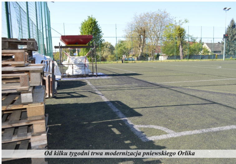
Od kilku tygodni trwa modernizacja pniewskiego Orlika

W specyfikacji przetargowej umieszczono szereg działań, które podejmuje wyłoniony w postępowaniu wykonawca. W pierwszej kolejności zabezpieczono teren budowy w sposób umożliwiający dostęp do bieżni lekkoatletycznej oraz kortu do tenisa ziemnego. W dalszej kolejności zaplanowano demontaż sztucznej trawy oraz jednego