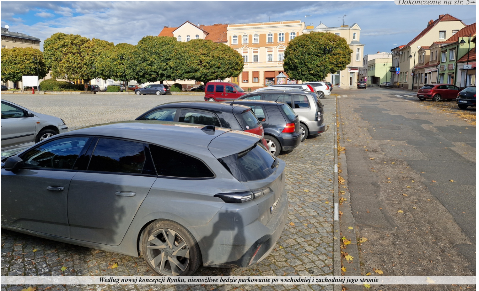
Według nowej koncepcji Rynku, niemożliwe będzie parkowanie po wschodniej i zachodniej jego stronie