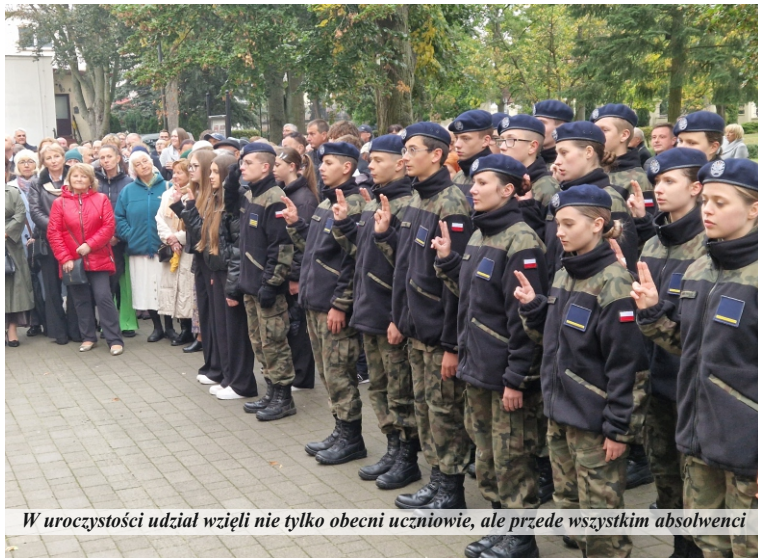
W uroczystości udział wzięli nie tylko obecni uczniowie, ale przede wszystkim absolwenci

Historia Liceum Ogólnokształcącego w Pniewach sięga 1945 roku, kiedy to tuż po zakończeniu II wojny światowej,