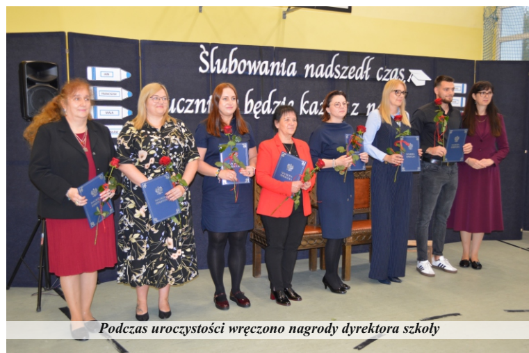
Podczas uroczystości wręczono nagrody dyrektora szkoły