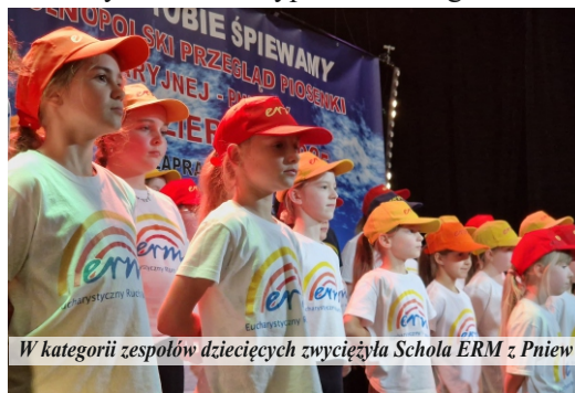
W kategorii zespołów dziecięcych zwyciężyła Schola ERM z Pniew