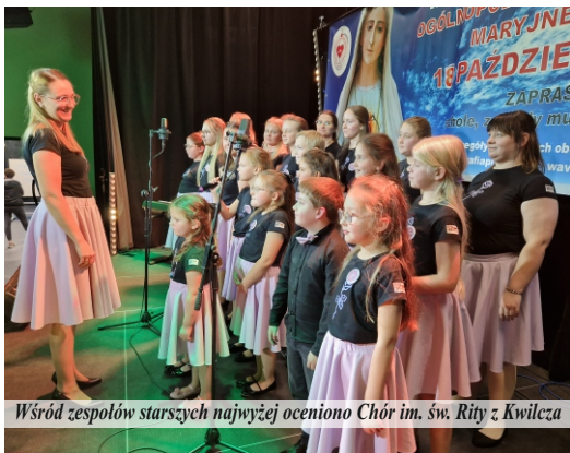
Wśród zespołów starszych najwyższą oceniono Chór im. św. Rity z Kwilcza

Po raz czwarty w Pniewach odbył się Przegląd Piosenki Maryjnej „Maryjo, Tobie śpiewamy”. Po raz drugi impreza miała charakter ogólnopolski. Wydarzenie miało miejsce 18 października w Bibliotece Publicznej Centrum Kultury w Pniewach.