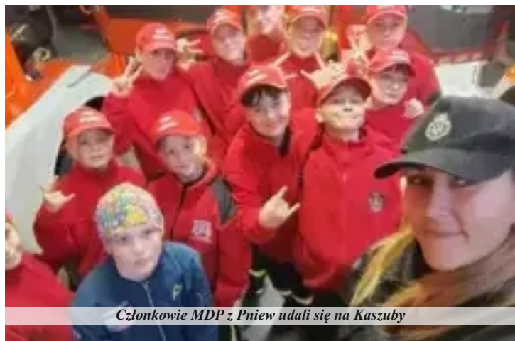
Członkowie MDP z Pniew udali się na Kaszuby

Młodzieżowa Drużyna Pożarnicza z Pniew gościła w partnerskiej gminie Kościerzyna. Wyjazd na Kaszuby odbył się w dniach 11-14 października.