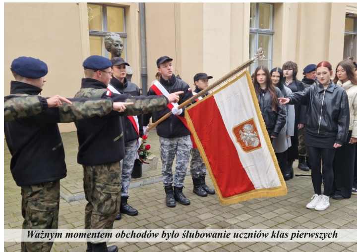
Ważnym momentem obchodów było ślubowanie uczniów klas pierwszych