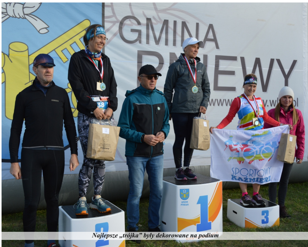
Najlepsze „trójka” były dekorowane na podium