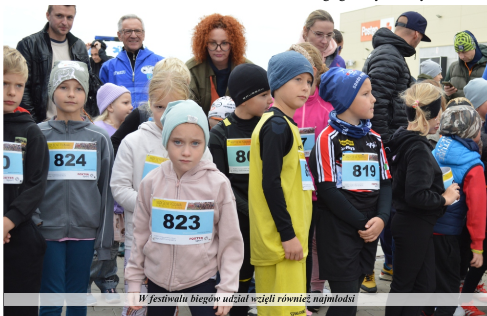
W festiwalu biegów udział wzięli również najmłodszy

Organizatorami XV Biegu Papieskiego i Festiwalu Biegów Ulicznych były: Ośrodek Sportu i Rekreacji w Pniewach, Szkoła Podstawowa im. Powstańców Wielkopolskich w Pniewach oraz Uczniowski Klub Sportowy „Pniewiak”.