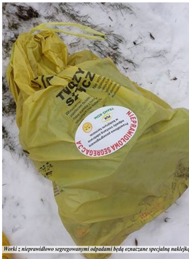
Worki z nieprawidłowo segregowanymi odpadami będą oznaczone specjalną naklejką

W przypadku stwierdzenia, że odpady zbierane są w sposób niezgodny z zasadami segregacji, nie będą podlegać odbiorowi. Pojemniki, worki zostaną oznaczone specjalną naklejką, „ NIEPRAWIDŁOWA SEGREGACJA ”. Oznacza to, że konieczna jest segregacja oraz umieszczenie odpadów w worku lub pojemniku odpowiednim dla danej frakcji. Prawidłowo posegregowane odpady zostaną odebrane przez