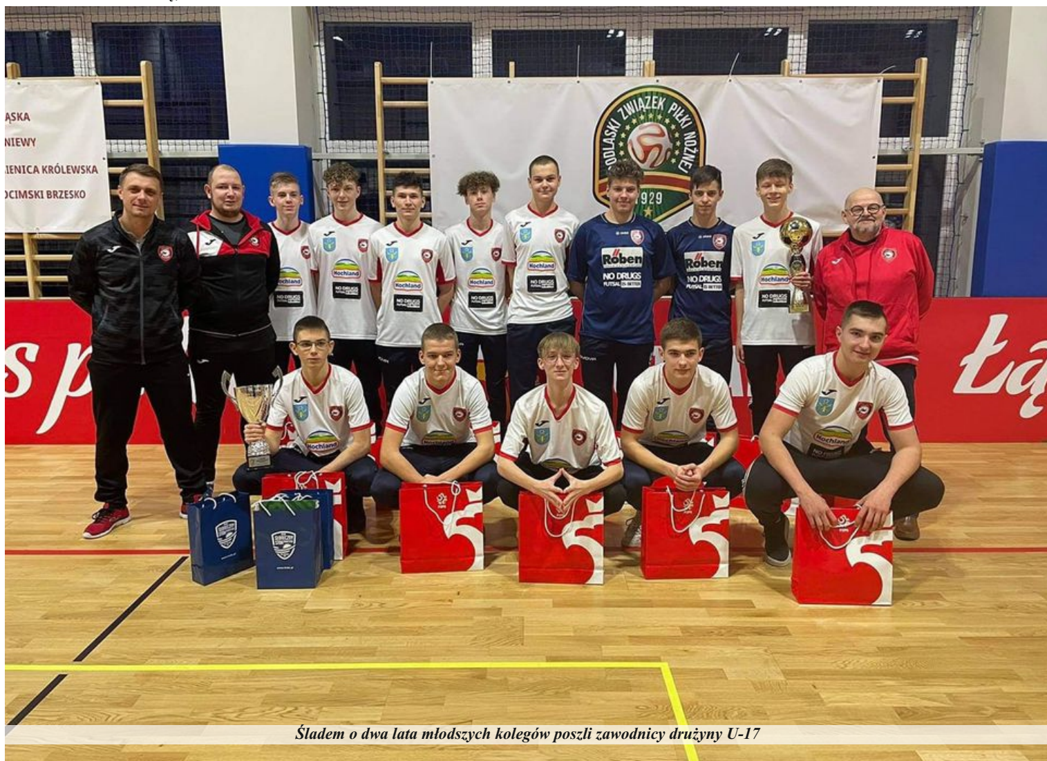
Śladem o dwa lata młodszych kolegów poszli zawodnicy drużyny U-17

W finałach Młodzieżowych Mistrzostw Polski zagrała także drużyna do lat 19. Zawody, w których udział wzięło szesnaście najlepszych drużyn w kraju odbywały się w dniach 26-28 lutego w Bielsku-Białej. Pniewianie przegrali pierwszy mecz w fazie grupowej z TAF Toruń 1:4. Mimo, iż w sobotę Red Dragons zremisowali z gospodarzami – Rekordem Bielsko-Biała 3:3 i wygrali z Beniaminkiem 03 Starogard Gdański 7:1, ostatecznie zajęli trzecie miejsce w grupie, nie uzyskując awansu do fazy pucharowej. Pniewianie pozostawili jednak po sobie bardzo dobre wrażenie. Kolejny zespół, zgłoszony do krajowych rozgrywek przez pniewski klub udowodnił, że szkolenie młodzieży w Pniewach prowadzone jest w bardzo dobrym kierunku.