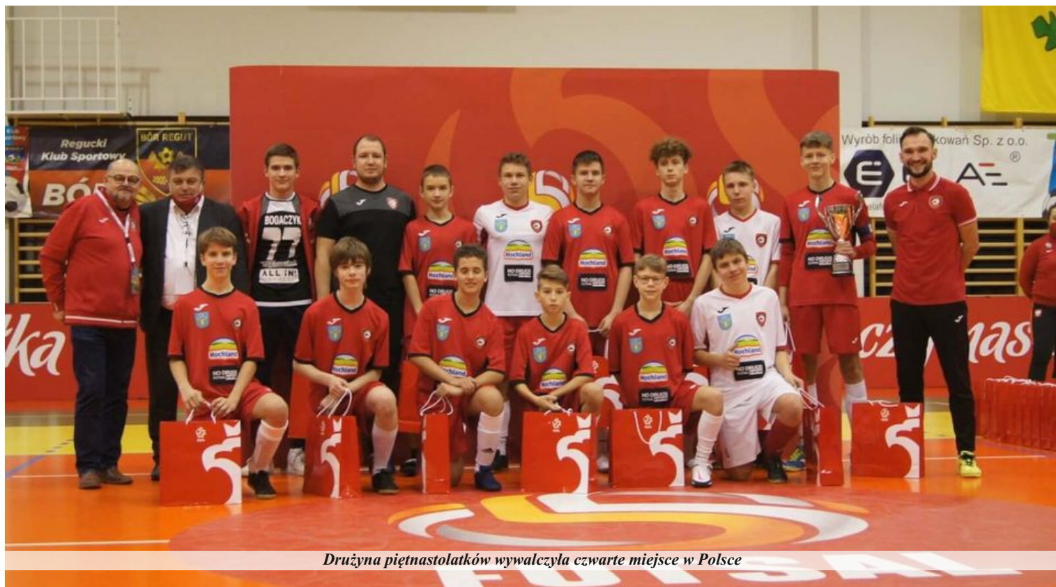
Drużyna piętnastolatków wywalczyła czwarte miejsce w Polsce