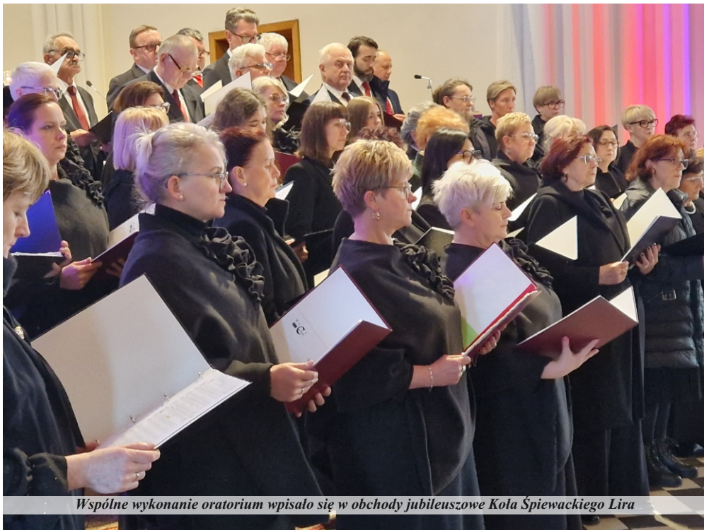
Wspólne wykonanie oratorium wpisało się w obchody jubileuszowe Koła Śpiewackiego Lira

Oratorium to wielka forma muzyczna wokalnie-instrumentalna, wykonywana początkowo w kościele, a obecnie zazwyczaj na estradzie koncertowej. W wykonaniach oratorium biorą udział śpiewacy-soliści, chór i orkiestra. Epickie fragmenty recytuje narrator, czasem rolę tę przejmuje chór. Oratorium zbliżone jest do opery, lecz pozbawione jest akcji scenicznej, a jego tematyka najczęściej jest religijna: kompozytorzy katolicy zazwyczaj wybierali tematy z życia świętych, natomiast w krajach protestanckich treścią librett oratoriów zazwyczaj były motywy biblijne. U schyłku XVIII w. pojawiać zaczęły się też tematy świeckie, choć należą one do rzadkości. Szczególnym gatunkiem oratorium jest pasja – forma przedstawiająca mękę Chrystusa i wydarzenia ją poprzedzające.