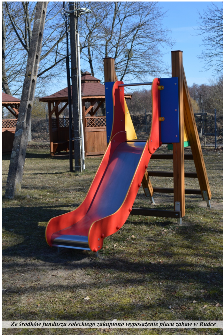
Ze środków funduszu sołeckiego zakupiono wyposażenie placu zabaw w Rudce

W sołectwach gminy Pniewy wydatkowano w ramach funduszu sołeckiego na: zakup materiałów eksploatacyjnych, naprawę i konserwacja sprzętu; doposażenie sołectwa; wsparcie jednostek OSP i remonty bieżące budynków; opracowywanie strategii rozwoju wsi i tworzenie strategii Smart Villages; utrzymanie dróg gminnych na terenie sołectwa; poprawę estetyki wsi; zakup i montaż AED; doposażenie świetlicy wiejskiej oraz koszty bieżącego utrzymania obiektu; uzupełnianie infrastruktury rekreacyjnej i kulturalnej; działalność na rzecz rozwoju edukacji, kultury, sportu i zdrowia oraz pobudzanie aktywności mieszkańców; zadania inwestycyjne.