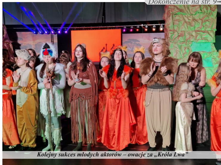
Dokończenie na str. 9

krawieckie. „Mulan” i „Mała Syrenka” były kolejnymi sztukami potwierdzającymi ogromne zaangażowanie uczniów, nauczycieli i osób wspomagających i jednocześnie potwierdzającymi oczekiwania mieszkańców Pniew, a nawet gmin ościennych. Nie jest niespodzianką, która bajka będzie wystawiana jako kolejna, gdyż w ciągu roku, na kilku pniewskich imprezach m.in. Dniach Pniew wystawiane są zwiastuny kolejnego przedsięwzięcia. Promocja wydarzenia trwa zatem przez cały rok. I już wiosną ubiegłego roku wiadomo było, że kolejną przygotowywaną bajką jest „Król Lew”. Od tego momentu młodzi aktorzy spędzili niezliczoną ilość