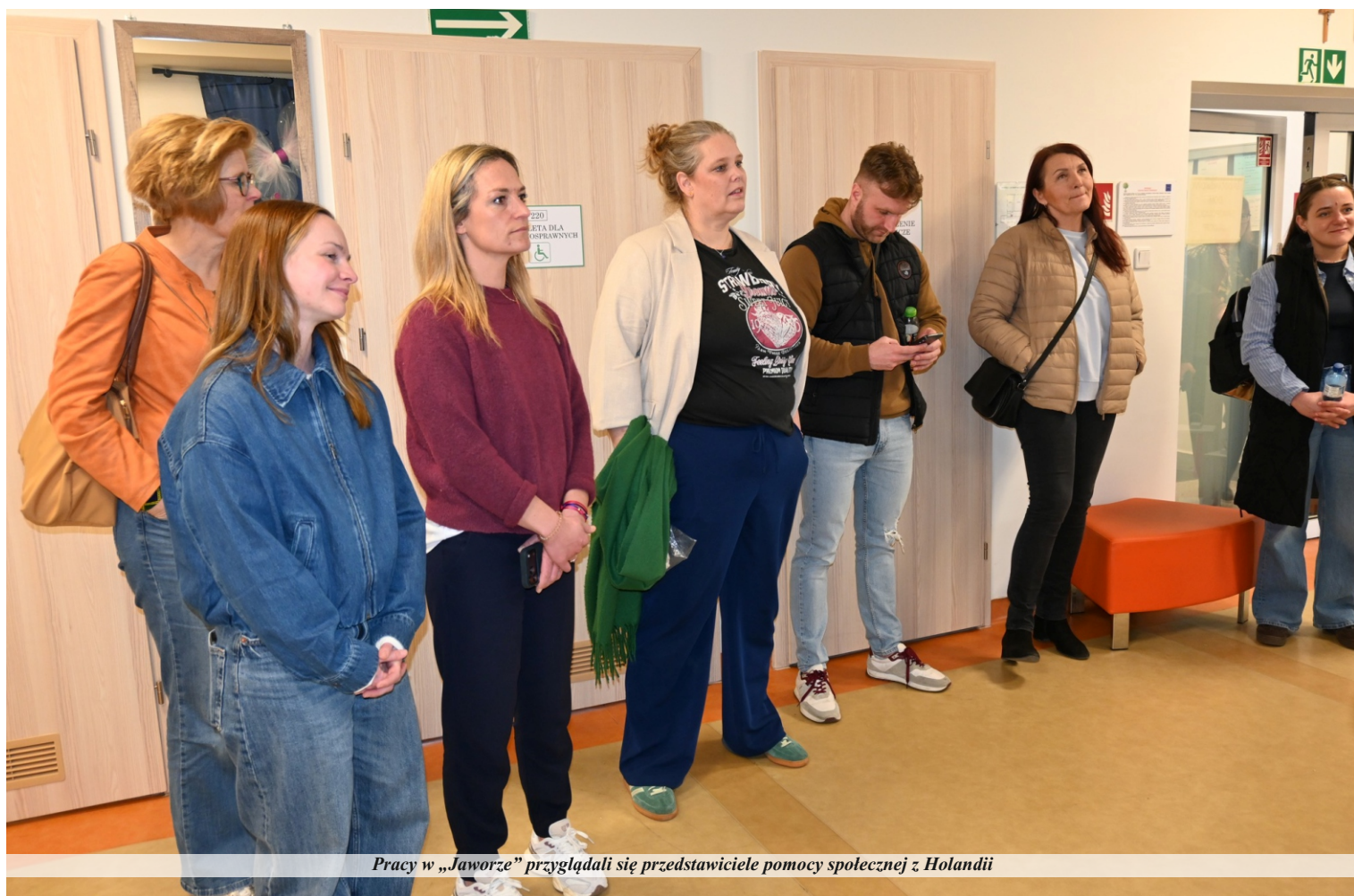
Pracy w „Jaworze” przyglądali się przedstawiciele pomocy społecznej z Holandii