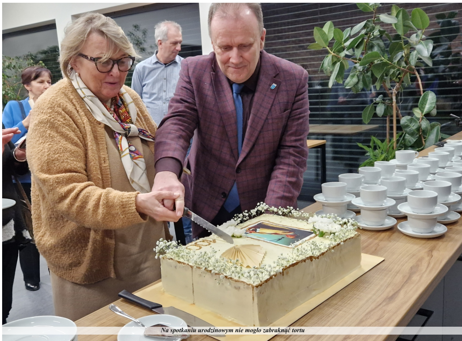
Na spotkaniu urodzinowym nie mogło zabraknąć tortu