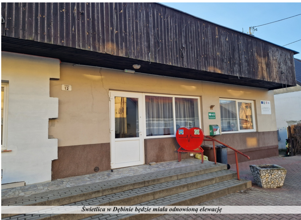
Świetlica w Dębinie będzie miała odnowioną elewację

wykonanie palisady betonowej i ściany pod donice betonowe; wykonanie nawierzchni z kostki brukowej betonowej. Zadanie ma być wykonane do 15 maja.