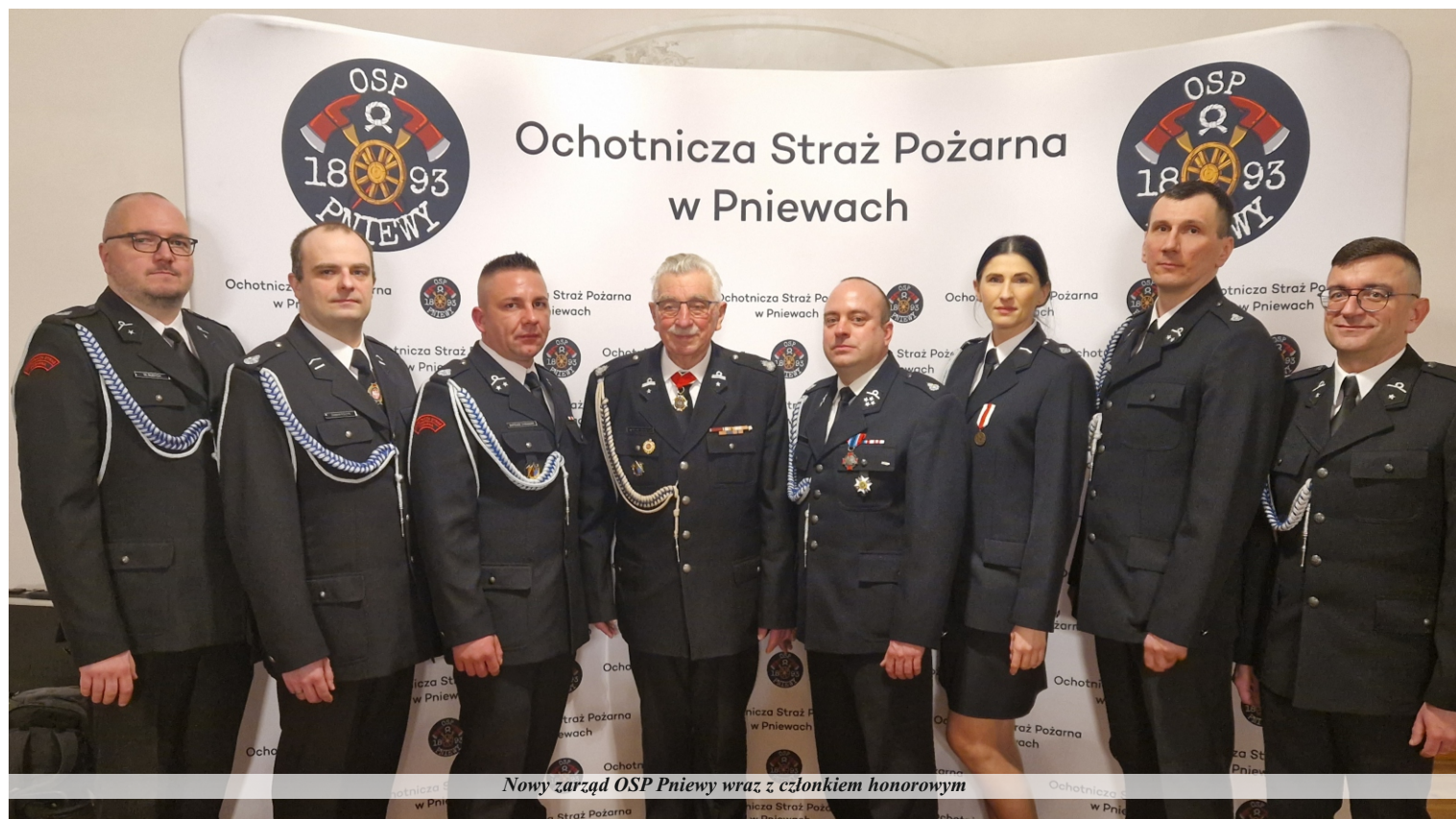
Nowy zarząd OSP Pniewy wraz z członkiem honorowym