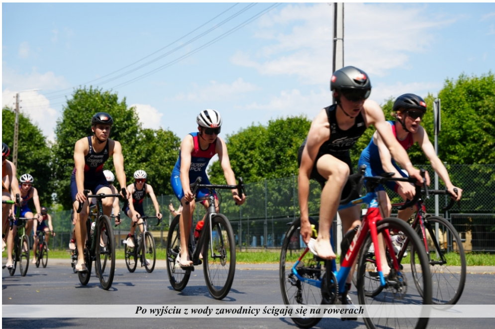
Po wyjściu z wody zawodnicy ścigają się na rowerach

12 Triathlon Pniewy odbył się w niedzielę 21 czerwca. Pierwsi do wody weszli, bo już o godz. 9.00, uczestnicy mistrzostw Wielkopolski w triathlonie dzieci. Ta grupa rywalizowała w pływaniu na dystansie 100 metrów, jeździe na rowerze na dystansie 4 kilometrów i biegu na 1000 metrów. Trzy kwadranse później wystartowali zawodnicy w kategorii 1/4 Ironman. To już rywalizacja dla samych twardzieli – 950 metrów pływania, 45 km jazdy na rowerze i 10,55 km biegu. Najlepszym paniom zajęło to około trzech godzin. Czołówka panów zmieściła się w 150 minutach. O godzinie 14:00 ruszyła pierwsza grupa Pucharu Polski w Triathlonie. Rywalizowali juniorzy