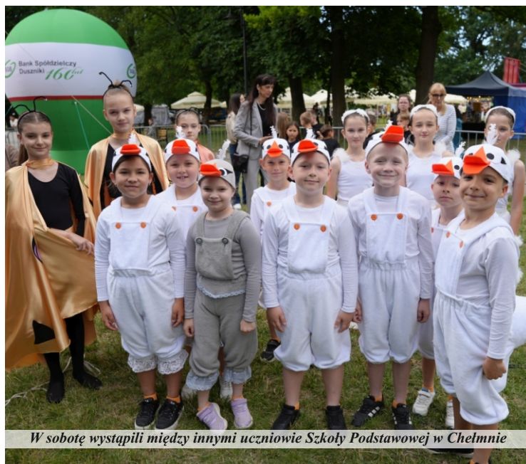
W sobotę wystąpili między innymi uczniowie Szkoły Podstawowej w Chelmnie

Tegoroczne Dni Pniew przebiegły w atmosferze niepewności o dogodne warunki pogodowe i walką z jej skutkami. To jeden z niewielu elementów programu, którego nie da się wcześniej zaplanować, aczkolwiek trzeba być przygotowanym na ewentualność wystąpienia. Raz na kilka lat tak się niestety zdarza.