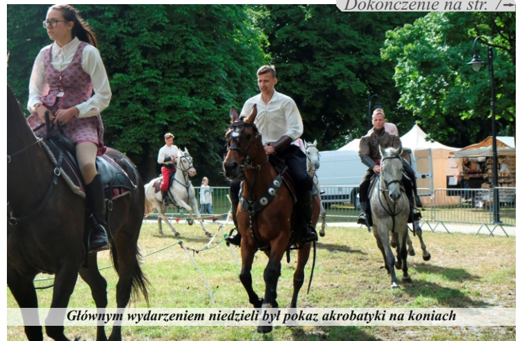
Głównym wydarzeniem niedzieli był pokaz akrobatyki na koniach