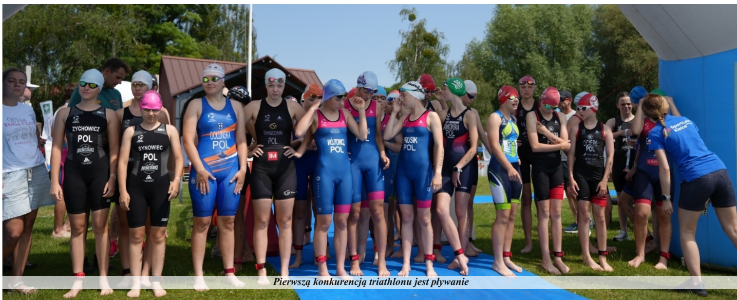
Pierwszą konkurencją triathlonu jest pływanie