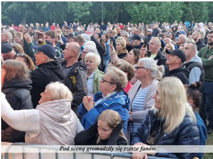
Pod sceną gromadziły się rzesze fanów

Najbogatszym dniem w wydarzenia kulturalne była sobota. Od 16.00 na scenie głównej prezentowały się dzieci z Przedszkola „Miś”, szkół podstawowych w Pniewach i Chełmnie oraz grupy tanecznej Twister. Dla najmłodszych widzów na scenie wystąpił Wujek Ogórek, a następnie publiczność mogła wysłuchać koncertu „Piosenek