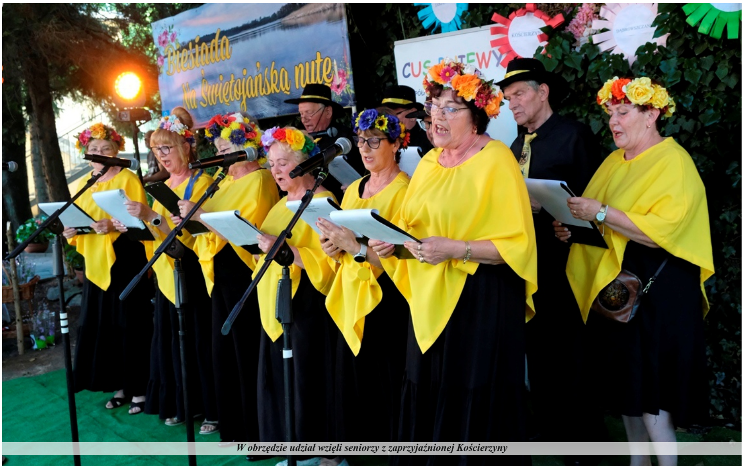
W obrzędzie udział wzięli seniorzy z zaprzyjaźnionej Kościerzyny

Druga część obrzędowego wieczoru odbyła się w Łazienkach Miejskich, dokąd seniorzy przeszli w korowodzie. Tam odbyły się tradycyjne obrzędy nocy świętojańskiej, których zwieńczeniem było symboliczne puszczanie wianków na wodę – jeden z najpiękniejszych i najbardziej rozpoznawalnych zwyczajów związanych z tym świętem.