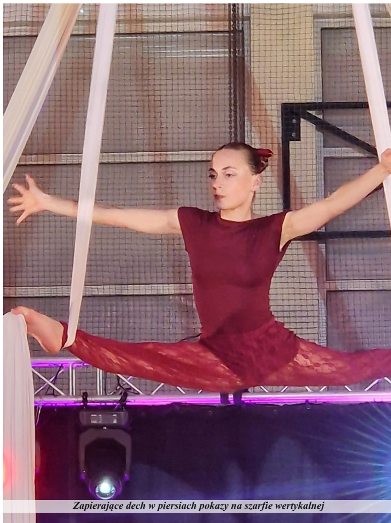
Zapierające dech w piersiach pokazy na szarfie wertykalnej