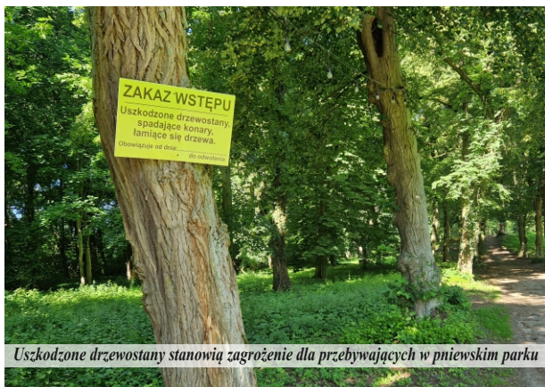
Uszkodzone drzewostany stanowią zagrożenie dla przebywających w pniewskim parku