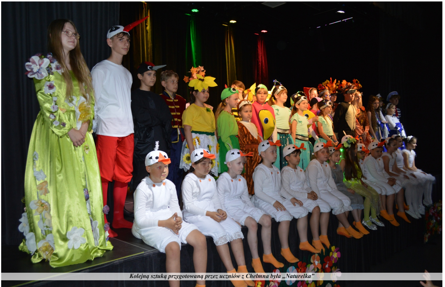
Kolejną sztuką przygotowaną przez uczniów z Chełmna była „Naturelka”