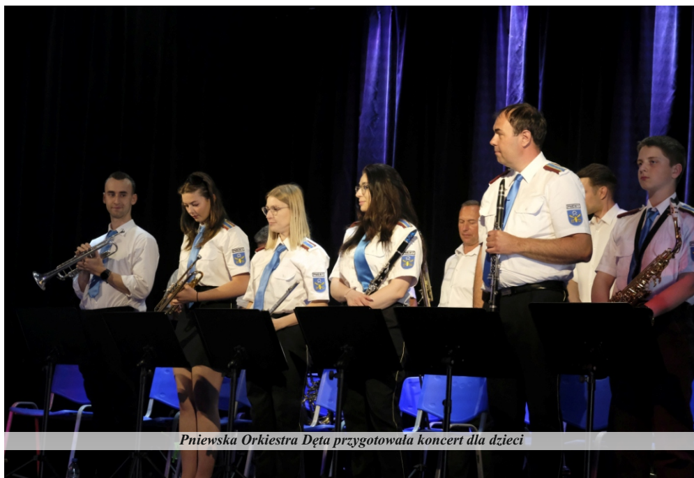
Pniewska Orkiestra Dęta przygotowała koncert dla dzieci

Każdy mógł znaleźć coś dla siebie – od kącików artystycznych i balonowego zoo, po dmuchańce, konkursy oraz kolorowe animacje. Miłośnicy motoryzacji mogli z bliska