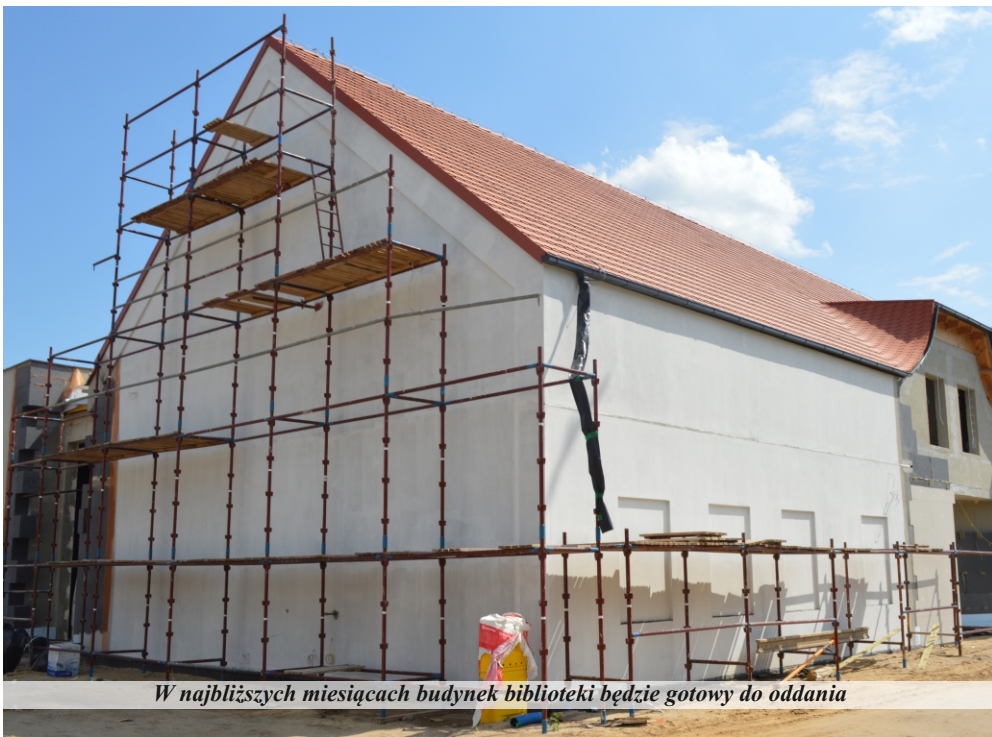
W najbliższych miesiącach budynek biblioteki będzie gotowy do oddania

W nowym obiekcie zaprojektowano: salę na ok. 200 osób wraz z magazynem i aneksem kuchennym, scenę, wypożyczalnię (oddział dla dzieci), toalety, pokój rodzica z dzieckiem, wypożyczalnia dla dorosłych, pomieszczenie socjalne,