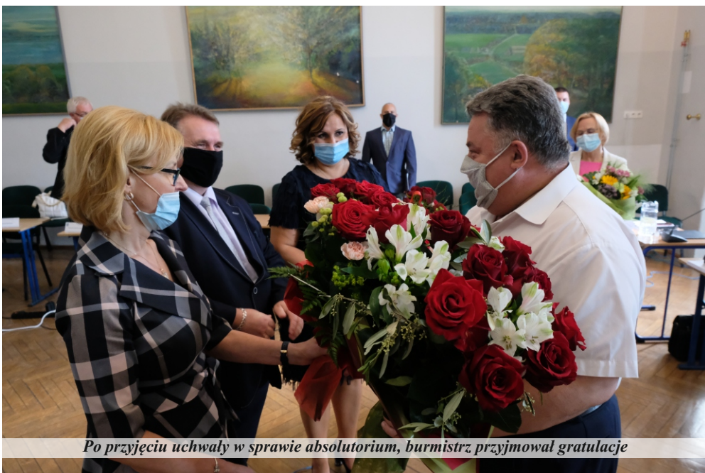
Po przyjęciu uchwały w sprawie absolutorium, burmistrz przyjmował gratulacje

W 2020 roku gmina Pniewy wyemitowała obligacje samorządowe o wartości 4.600.000 zł zapewniając płynność finansową dla zadań realizowanych z dofinansowaniem środków europejskich. Równocześnie gmina Pniewy dokonała wykupu obligacji wcześniej wyemitowanych o wartości 3.000.000 zł,