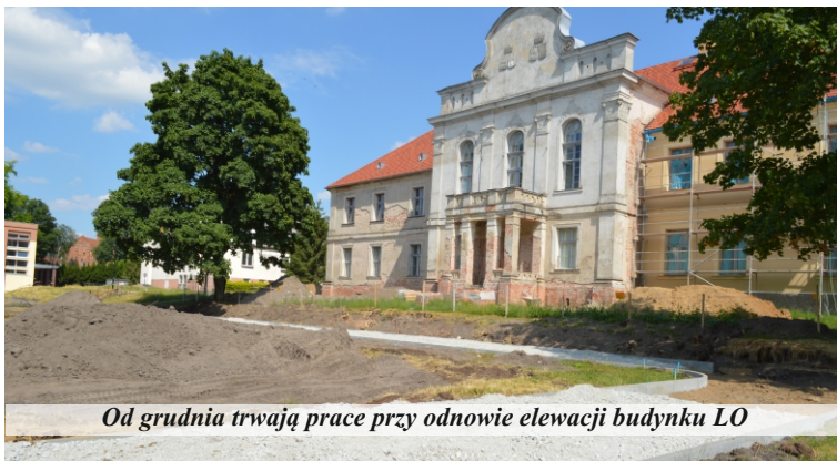
Od grudnia trwają prace przy odnowie elewacji budynku LO

W siódmym miesiącu prac przy odnowie elewacji budynku pałacowego, na ścianę południową i fragment zachodniej położono nowy tynk. Tempo prac przy odnowie elewacji budynku pałacowego w Pniewach może nie jest imponujące, ale efekt końcowy ma być warty długiego oczekiwania. Zadanie, wpisujące się w pierwszy etap rewitalizacji miasta rozpoczęto w grudniu ubiegłego roku.