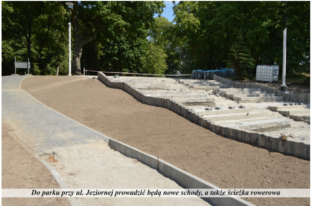
Do parku przy ul. Jeziornej prowadzić będą nowe schody, a także ścieżka rowerowa

Trwające obecnie prace w parku między ulicami Jeziorną, a Międzychodzką mają na celu budowę oświetlenia ulicznego w parku, remont schodów od strony ulicy Jeziornej, wykonanie nawierzchni z kostki betonowej bezfazowej grafitowej. Zlecono ponadto budowę ścieku z dwóch rzędów kostki brukowej betonowej, a