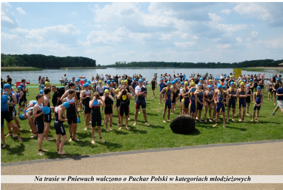
Na trasie w Pniewach walczone o Puchar Polski w kategoriach młodzieżowych

W tym roku zawody pniewskie zostały zdominowane przez konkurencje młodzieżowe, w których walczone o Puchar Polski. W czterech kategoriach: