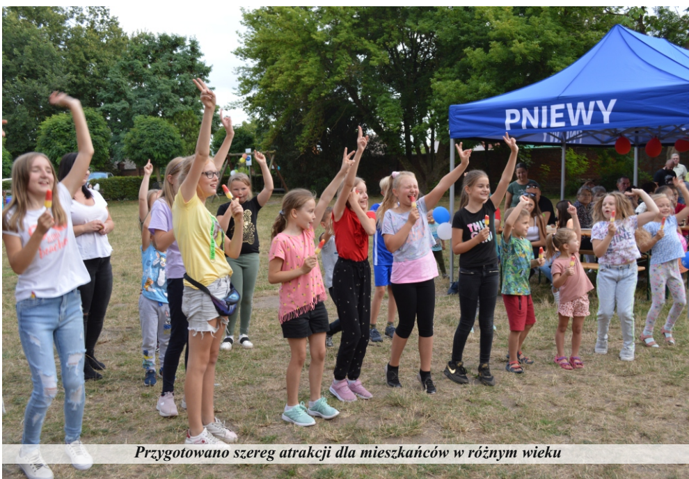
Przygotowano szereg atrakcji dla mieszkańców w różnym wieku

Festyn w Turowie był wspólnym przedsięwzięciem organizacyjnym miejscowej Ochotniczej Straży Pożarnej,