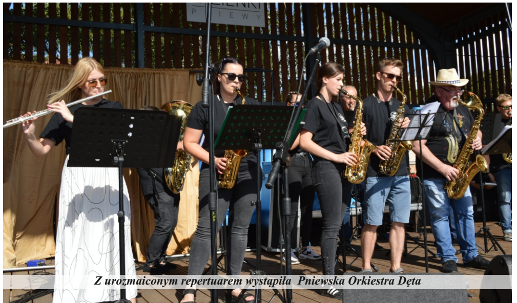
Z urozmaiconym repertuarem wystąpiła Pniewska Orkiestra Dęta