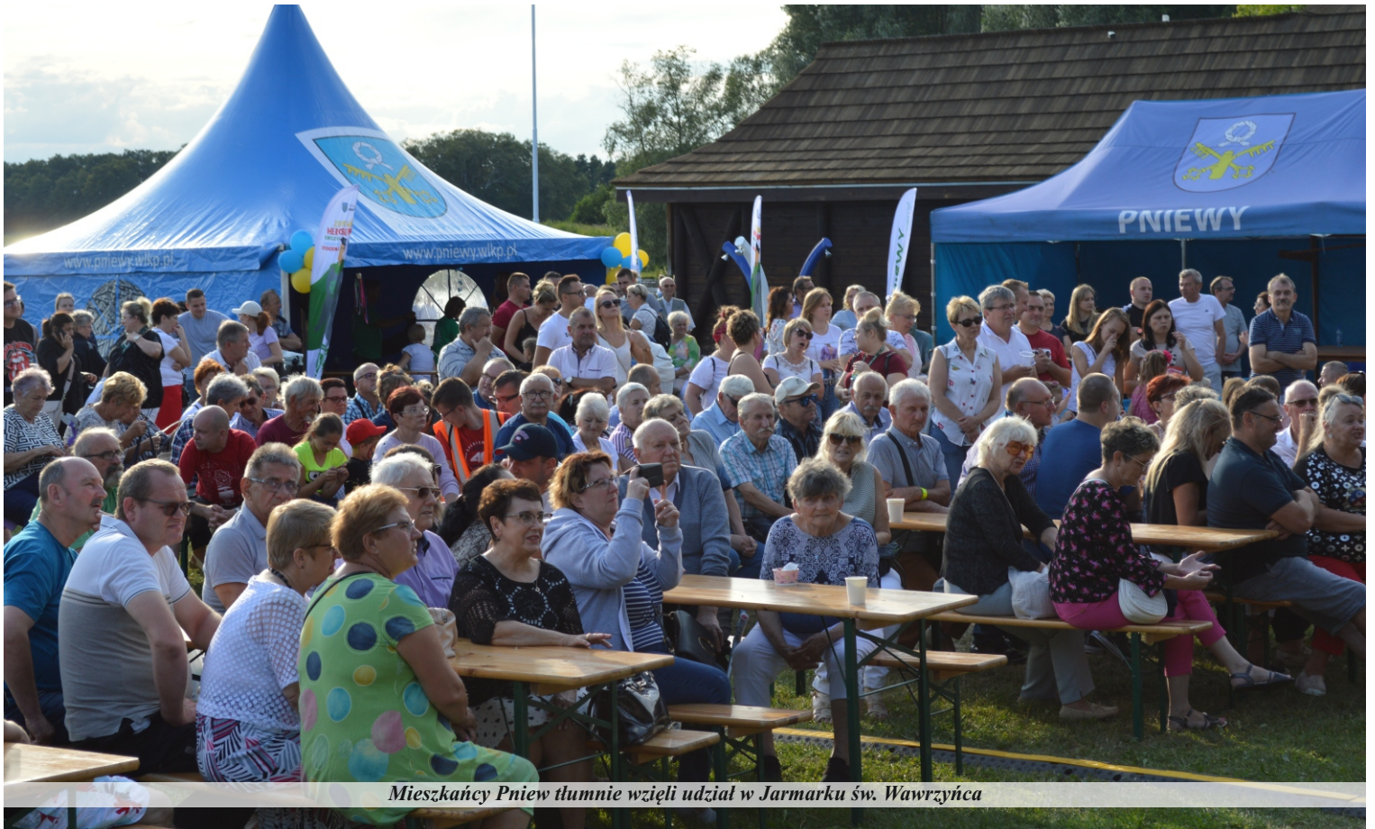
Mieszkańcy Pniewy tłumnie wzięli udział w Jarmarku św. Wawrzyńca

Oprócz wrażeń artystycznych, uczestnicy Jarmarku św. Wawrzyńca mieli na wyciągnięcie ręki inne atrakcje i możliwości. Wśród atrakcji dominowały te dla dzieci – dmuchane zamki, wypożyczalnia małych samochodów, czy zabawy z wodą, przygotowane przez Pniewskie Przedsiębiorstwo Komunalne. Dorośli odwiedzali stoiska handlowe, mieli możliwość dokonania spisu w Narodowym Spisie Powszechnym, a także zaszczepić się jednodawkową szczepionką przeciw Covid-19.