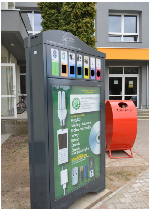
Do urządzeń na elektroodpady można wrzucać m.in. baterie czy telefony

Mieszkańcy gminy Pniew mogą oddawać posegregowane odpady na kilka sposobów. Z posesji zabierane są cztery frakcje odpadów: plastikowe i metalowe (w worku żółtym), szkło (w worku zielonym), papier (w worku niebieskim) oraz odpady biodegradowalne (w worku brązowym). Dwa razy w roku spod posesji odbierane są odpady wielkogabarytowe oraz zużyty sprzęt elektroniczny. Ponadto w pniewskich aptekach można oddawać leki przeterminowane. Trzy urządzenia postawione na terenie miasta ułatwią segregację odpadów zaliczonych do grupy niebezpiecznych.