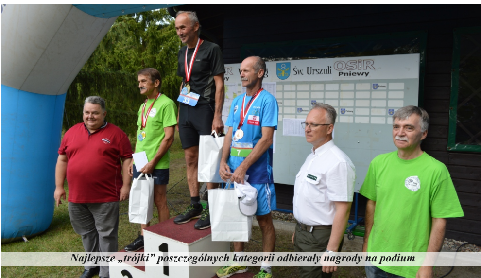
Najlepsze „trójki” poszczególnych kategorii odbierały nagrody na podium