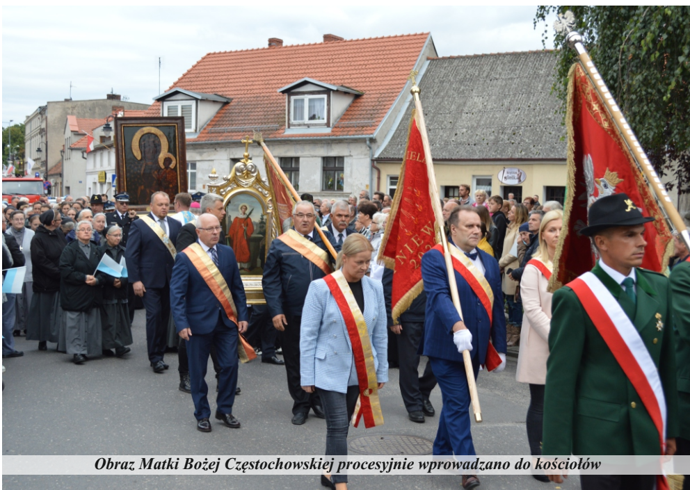
Obraz Matki Bożej Częstochowskiej procesyjnie wprowadzono do kościołów

Wizerunek Matki Bożej Częstochowskiej podróżował po dekanacie pniewskim od Otorowa, kolejno przez Bytyń, Wilczynę,