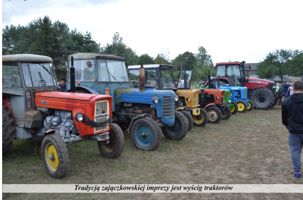
Tradycją zajączkowskiej imprezy jest wyścig traktorów

samochodu. Zbudowane w ten sposób drużyny walczą przede wszystkim z trasą wyznaczoną w naturze i z czasem, a korespondencyjnie rywalizują ze sobą. W tym roku po raz pierwszy wystawiono zespoły, reprezentujące stajnie. Do tej pory, w czterech poprzednich edycjach zgłaszano drużyny gminne. Oprócz aspektów sportowych festynu, można było obejrzeć pokaz traibballu, po polsku zwanego pasieniem piłek oraz Nose Work – pracy węchowej. Ponadto organizatorzy przygotowali pokaz psów ras dalekiej północy (Malamutów) pokaz ras i maści koni, a także pokaz ptaków drapieżnych, połączony z przedstawieniem historii sokolnictwa. Organizatorem zajączkowskiego „Wyścigu przez wieki” były: Stowarzyszenie Miłośników Koni i Sportów Konnych „Luzak”, Stowarzyszenie Rowerzystów „Odjechani Team” oraz Stowarzyszenie Miłośników Zabytkowej Motoryzacji „Pasjonat”.