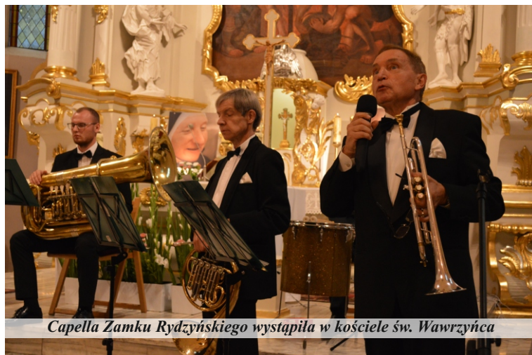
Capella Zamku Rydzyskiego wystąpiła w kościele św. Wawrzyńca

Wrześniowy koncert obfitował w utwory klasyczne – od renesansu do romantyzmu, a także znane fragmenty oper i operetek, muzykę lasem inspirowaną oraz religijną. W okresie poprzedzającym peregrynację kopii obrazu Matki Bożej Częstochowskiej, muzycy wykonali poruszającą i wzruszającą pierwotną wersję „Hejnału Jasnogórskiego”.