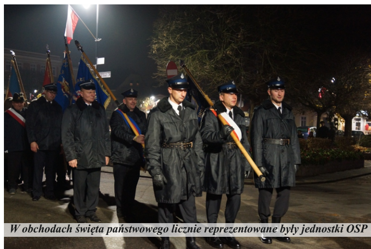
W obchodach święta państwowego licznie reprezentowane były jednostki OSP