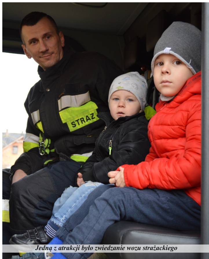
Jedną z atrakcji było zwiedzanie wozu strażackiego