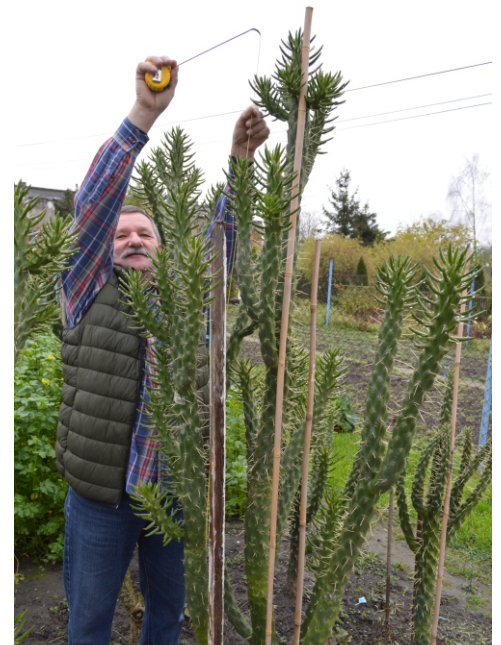
212 centymetrów liczy sobie największy kaktus w ogrodzie Krzysztofa Cembrowicza

W warunkach ogrodowych, bez pomocy człowieka kaktusy nie przetrwają. Gatunek uprawiany przez pana Krzysztofa należy do kruchych, nieodpornych na napory wiatru. Stąd konieczne jest ich wiązanie do palików. Nie można też pozwolić, by zostały