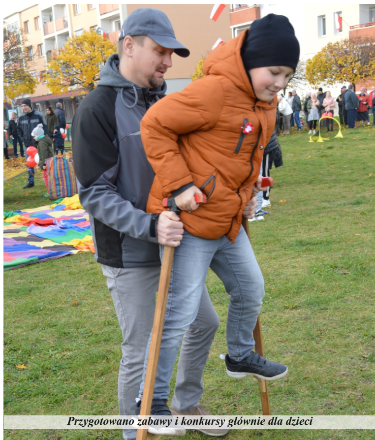
Przygotowano zabawy i konkursy głównie dla dzieci

Festyn organizowany przez grupę radnych Rady Miejskiej Pniewy odbywa się corocznie, z jedną tylko przerwą, w roku ubiegłym. Rozpoczyna się od przyjazdu świętego Marcina na białym koniu, któremu burmistrz przekazuje symboliczny klucz do miasta. Jest to okazja, szczególnie dla najmłodszych, aby uwiecznić to wydarzenie na fotografii. Ponadto mimo chłodu, dzieci chętnie uczestniczą w przygotowanych dla nich grach, zabawach, konkursach. Jedną z większych atrakcji tegorocznego festynu adresowanego była obecność wozów strażackich i możliwość wejścia do nich, dotknięcia strażackiego sprzętu. Na trawniku dzieci grały w unihokeja, chodziły na szczudłach, animatorzy prowadzili różne konkursy. Dorośli natomiast delektowali się kawą i rogalami. Szczególnie cenili sobie możliwość spotkania się oraz rozmów, gdyż w obecnych czasach mamy deficyt tego rodzaju przyjemności.