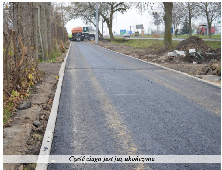
Część ciągu jest już ukończona

Ciąg pieszo-rowerowy przy ul. Lwóweckiej ma szerokość trzech metrów. Jego część jest już wykonana z betonu asfaltowego, ograniczona obustronnie obrzeżem. Na początkowym odcinku, liczącym ok. 250 metrów ścieżka zlokalizowana będzie w odległości 50 cm od jezdni. Na dalszym odcinku zlokalizowano ciąg po istniejącym śladzie – przy posesjach znajdujących się wzdłuż drogi wojewódzkiej. W opracowaniu ujęto dostosowanie się sytuacyjnie i wysokościowo do wszystkich zjazdów z dróg poprzecznych w granicach pasa drogowego, które zostały przebudowane w ramach niedawno prowadzonych inwestycji. Ujęto również w ramach konieczności remont istniejących zjazdów indywidualnych czy publicznych. Spływ wód opadowych umożliwią pochylenia poprzeczne i podłużne ciągu w kierunku rowu odwadniającego zlokalizowanego wzdłuż drogi wojewódzkiej lub na jezdnię do istniejącej sieci kanalizacji deszczowej. Zaprojektowano nową organizację ruchu. W ramach robót tereny zielone należy obhumusować na grubość 15 cm. Wszystkie tereny zielone wykonawca zadania musi obsiać trawą.