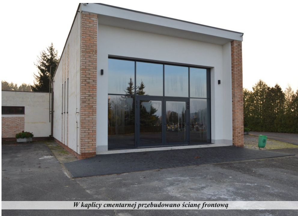
W kaplicy cmentarnej przebudowano ścianę frontową

Remont frontu kaplicy cmentarnej obejmował demontaż istniejącej ściany szklano-metalowej, montaż ściany szklano-aluminowej, odmalowanie fragmentu ściany, ułożenie kostki w strefie wejścia oraz zamontowanie oświetlenia. Koszt zadania wyniósł 104.690, 66 zł. Przeprowadzone prace miały na celu między innymi poprawę dostępności dla osób starszych i niepełnosprawnych. Zadanie wpisuje się w przyjęty przez Rząd RP program Dostępność Plus. Jego celem jest zapewnienie swobodnego dostępu do dóbr, usług oraz możliwości udziału w życiu społecznym i publicznym osób o szczególnych potrzebach. Koncentruje się na dostosowaniu przestrzeni publicznej, architektury, transportu i produktów do wymagań wszystkich