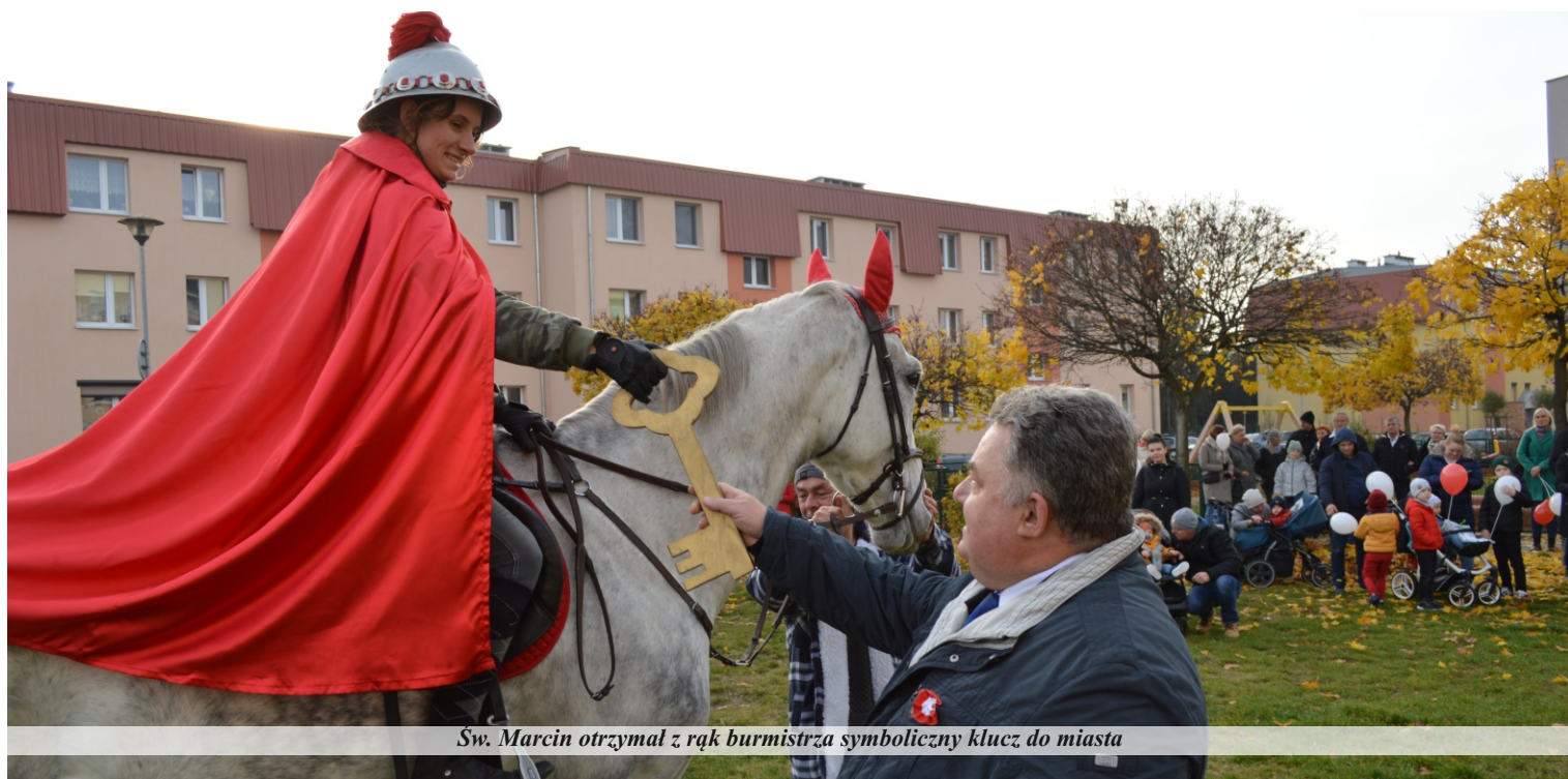
Św. Marcin otrzymał z rąk burmistrza symboliczny klucz do miasta