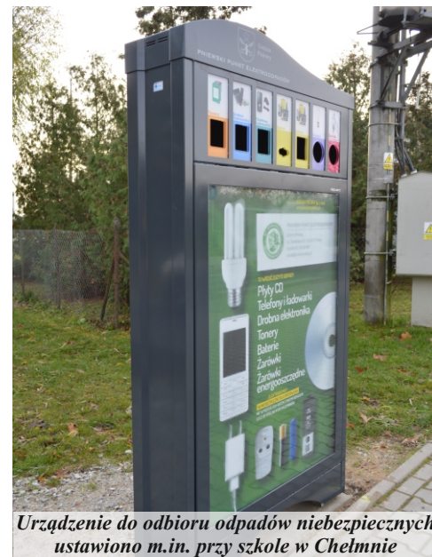
Urządzenie do odbioru odpadów niebezpiecznych ustawiono m.in. przy szkole w Chełmnie

Mieszkańcy gminy Pniewy mogą oddawać posegregowane odpady na kilka sposobów. Z posesji zabierane są cztery frakcje odpadów: plastikowe i metalowe (w worku żółtym), szkło (w worku zielonym), papier (w worku niebieskim) oraz odpady biodegradowalne (w worku brązowym). Dwa razy w roku spod posesji odbierane są odpady wielkogabarytowe oraz zużyty sprzęt elektroniczny. Ponadto w pniewskich aptekach można oddawać leki przeterminowane. Urządzenia postawione na terenie miasta i gminy ułatwią segregację odpadów zaliczonych do grupy niebezpiecznych.