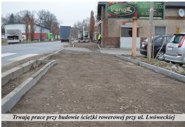
Trwają prace przy budowie ścieżki rowerowej przy ul. Lwóweckiej

Znacznie dłuższy odcinek realizuje Wielkopolski Zarząd Dróg Wojewódzkich, będący jednostką organizacyjną Urzędu Marszałkowskiego Województwa Wielkopolskiego. Budowany obecnie ciąg pieszo-rowerowy bierze swój początek przy skrzyżowaniu z ul. Turowską, a kończy się przy zjeździe do Głównego Punktu Zasilania (popularna rozdzielnia).