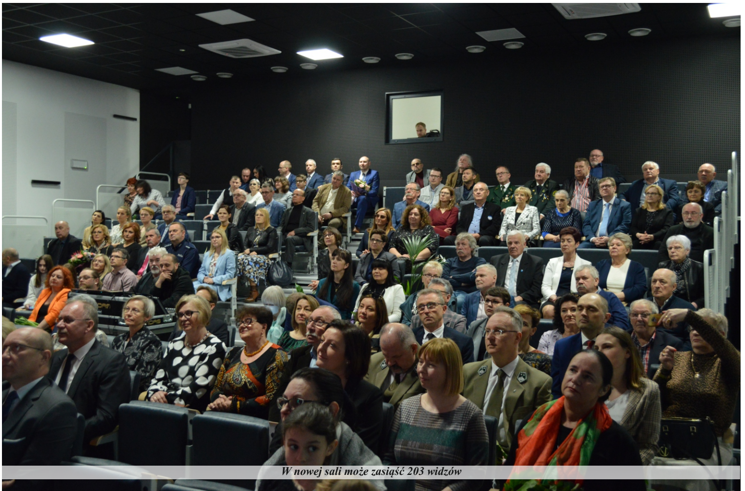
W nowej sali może zasiąść 203 widzów