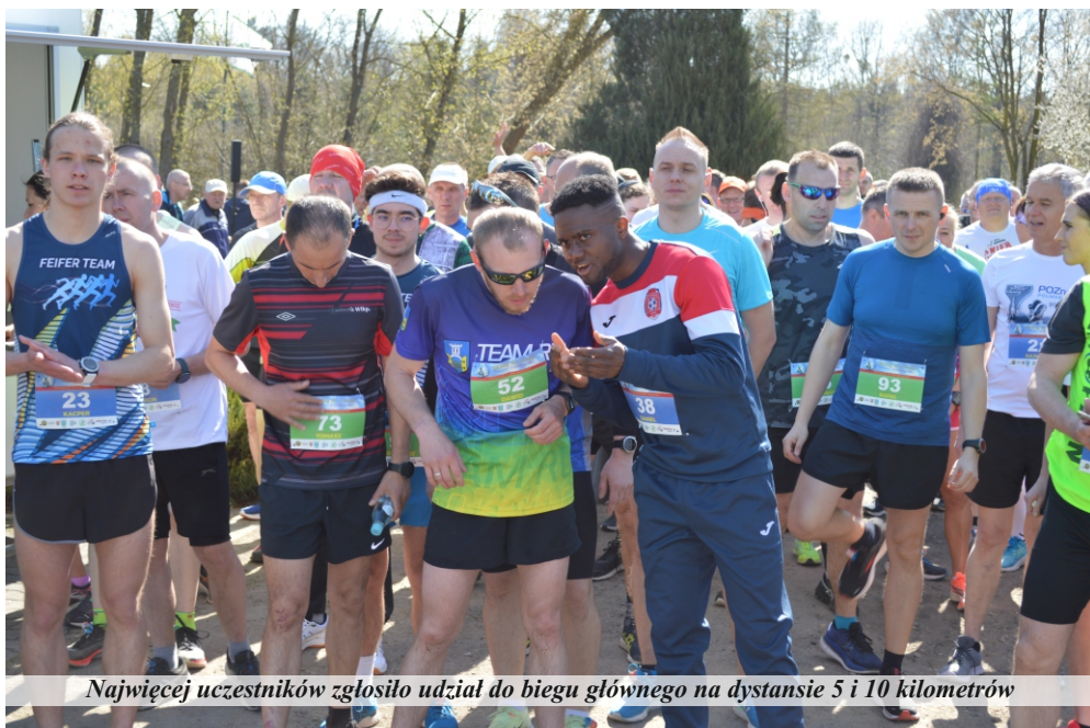
Najwięcej uczestników zgłosiło udział do biegu głównego na dystansie 5 i 10 kilometrów

Bieg św. Urszuli to nie tylko konkurencje biegowe. Na miejscu startu i mety zawsze przygotowywane są też inne atrakcje, głównie dla dzieci. Najmłodszy mogli spróbować sił między innymi w strzelaniu z łuku, na równoważni czy pojeździć nietypowym rowerem. Główną atrakcją