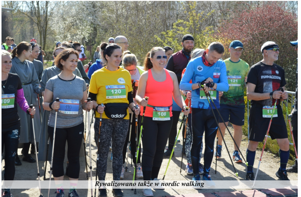
Rywalizowano także w nordic walking