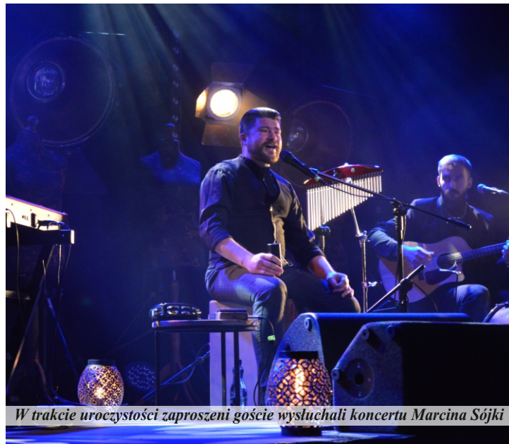
W trakcie uroczystości zaproszeni goście wysłuchali koncertu Marcina Sójki

W części artystycznej odbył się koncert Marcina Sójki, zwycięzcy dziewiątej edycji programu The Voice of Poland. Koncert zatytułowany „Intymnie” powtórzono wieczorem. Artysta śpiewał w wypełnionej po brzegi sali.