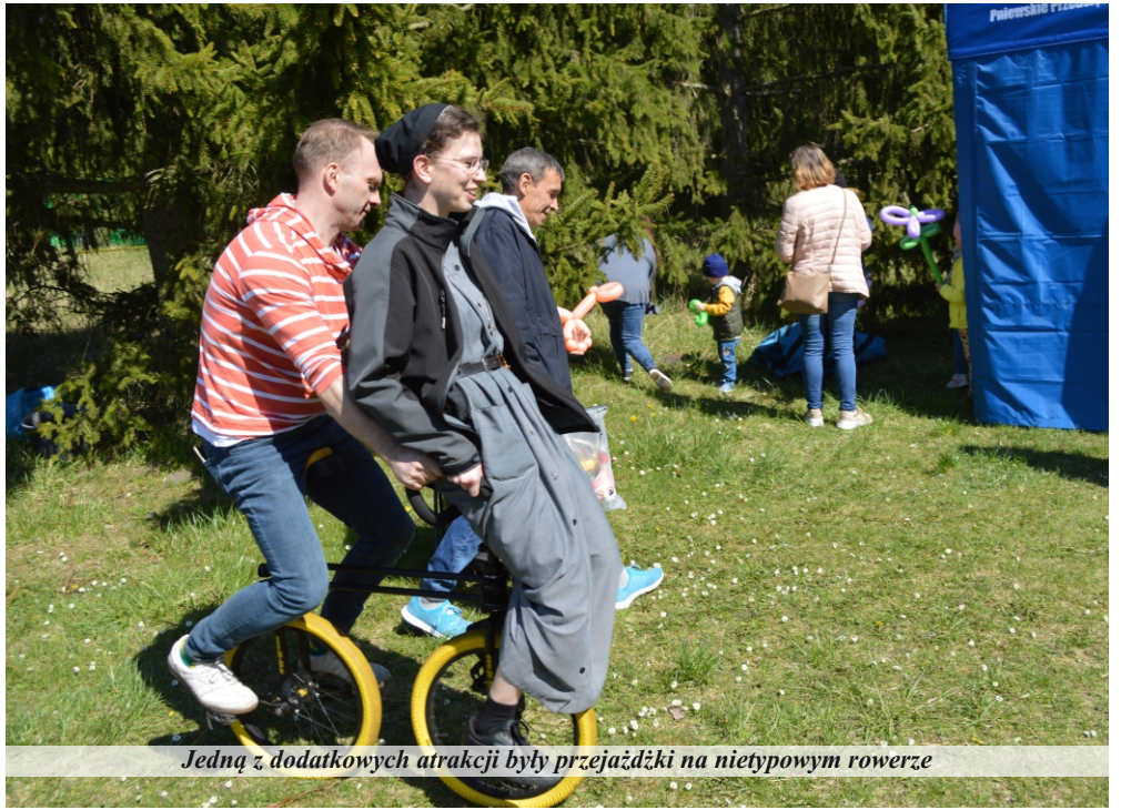
Jedną z dodatkowych atrakcji były przejażdżki na nietypowym rowerze