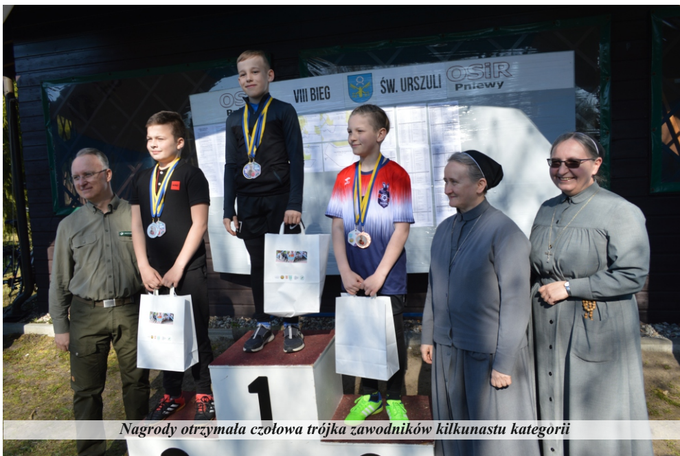
Nagrody otrzymała czołowa trójka zawodników kilkunastu kategorii