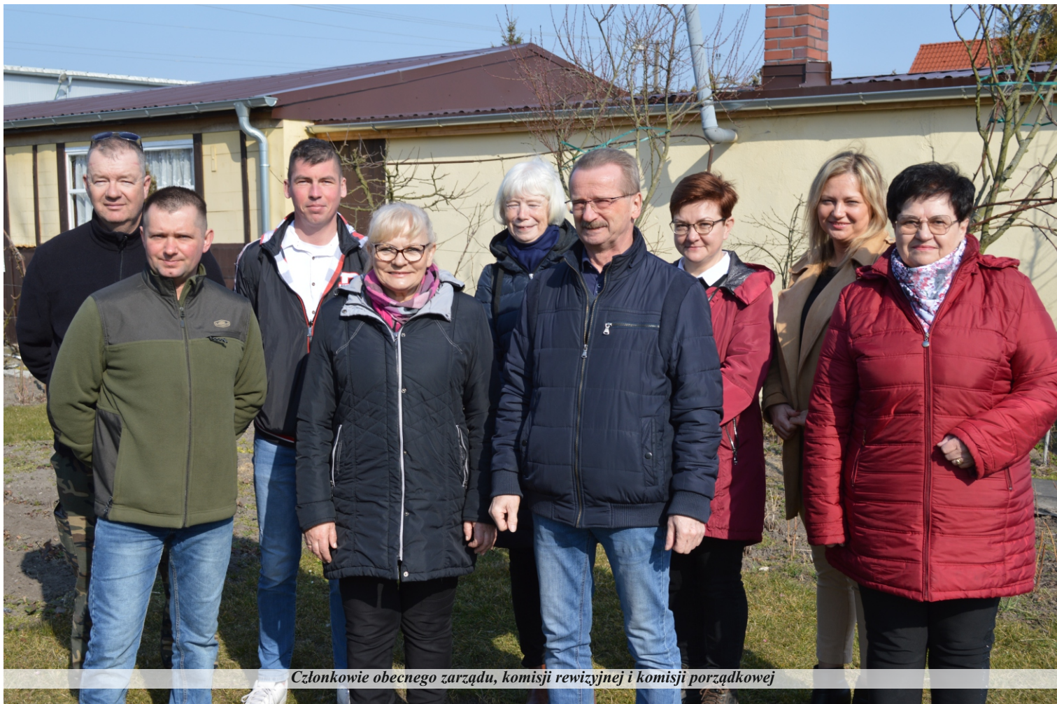
Członkowie obecnego zarządu, komisji rewizyjnej i komisji porządkowej