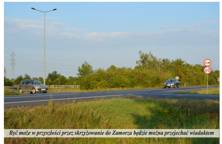
Być może w przyszłości przez skrzyżowanie do Zamorza będzie można przejechać wiaduktem

Generalna Dyrekcja Dróg Krajowych i Autostrad dała dużo czasu na przygotowanie projektu. Zgodnie ze specyfikacją, dokumentację należy wykonać w ciągu 810 dni od dnia podpisania umowy z wybranym wykonawcą. Wiadukt nie powstanie w najbliższych dwóch latach, ale światło w tunelu się zapaliło. W sierpniu Generalna Dyrekcja Dróg Krajowych i Autostrad rozstrzygnęła przetarg na zadanie, którego przedmiotem jest wykonanie dokumentacji projektowej dotyczącej rozbudowy drogi krajowej nr 24 na odcinku Pniewy – Rozbitek. W prowadzonym postępowaniu przetargowym wpłynęły cztery oferty. Najkorzystniejszą ofertę złożyła firma SMP Projektanci spółka z ograniczoną odpowiedzialnością sp. k. i zadeklarowała realizację zadania za kwotę 1.971.690,00 zł brutto. Zakres przedmiotu zamówienia obejmuje opracowanie dokumentacji projektowych wraz z uzyskaniem potrzebnych uzgodnień oraz