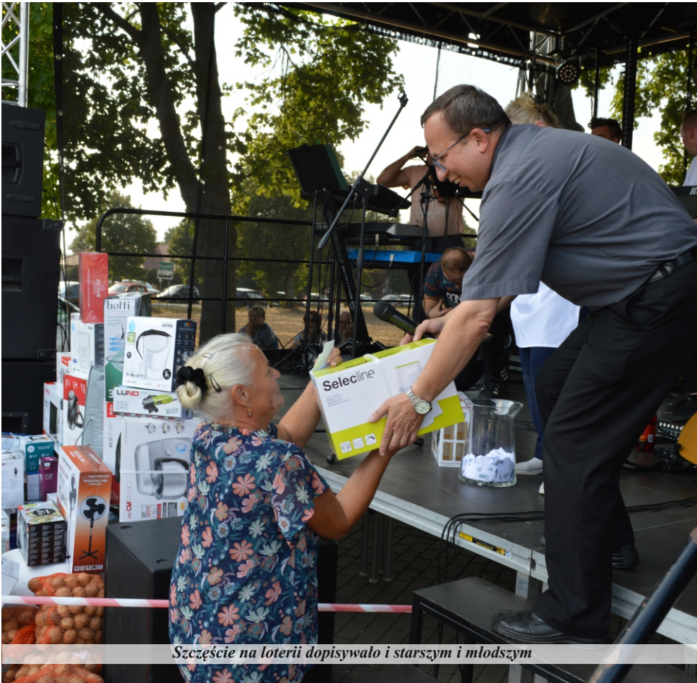
Szczęście na loterii dopisywało i starszym i młodszym