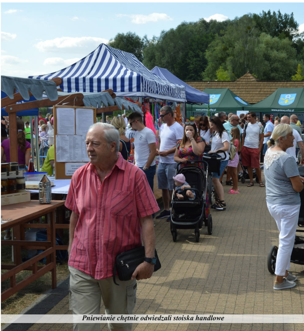
Pniewianie chętnie odwiedzali stoiska handlowe