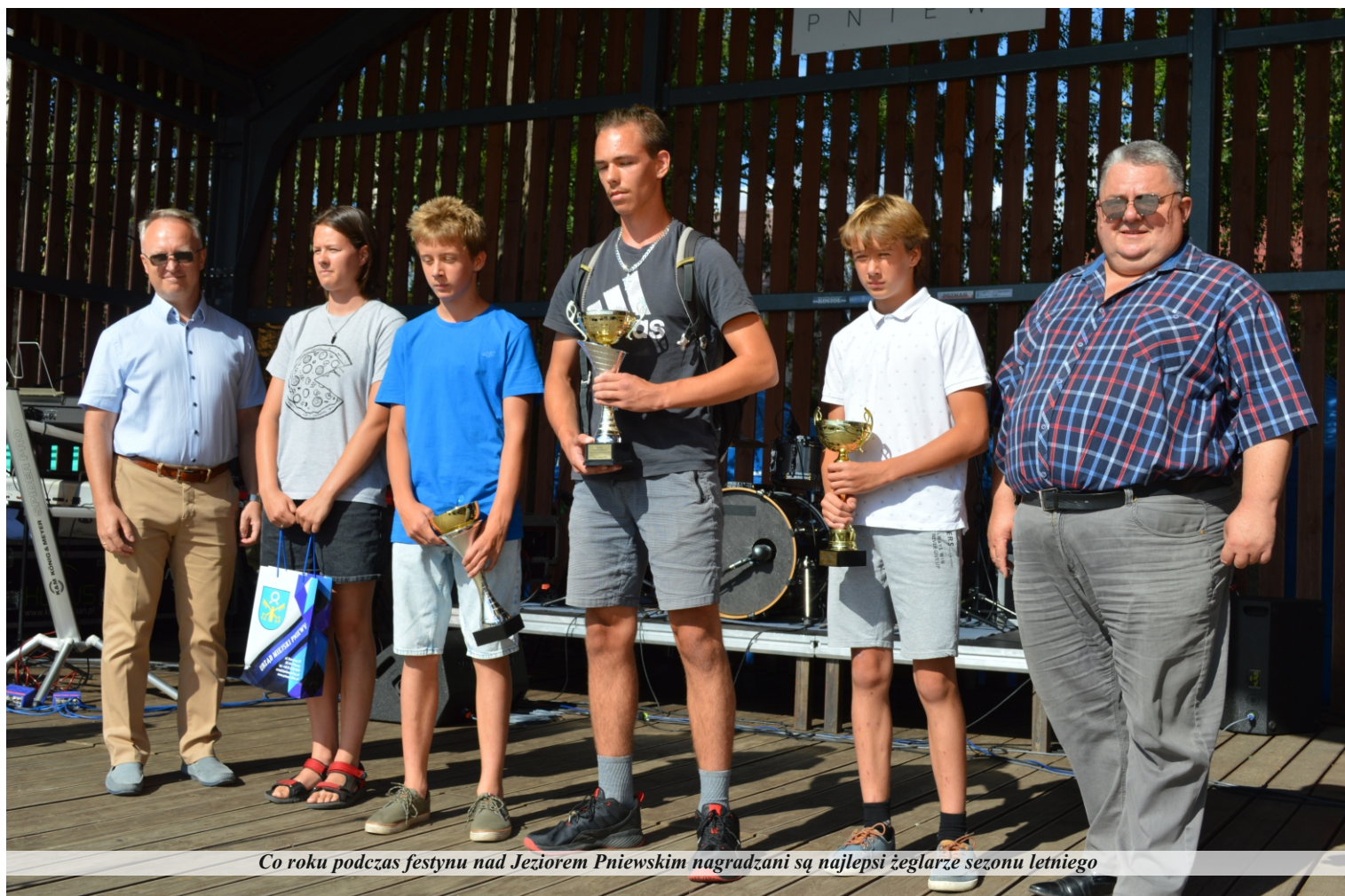
Co roku podczas festynu nad Jeziorem Pniewskim nagradzani są najlepsi żeglarze sezonu letniego

Od wielu lat festyn odpustowy ma charakter jarmarkowy. Na stoiskach swoje wyroby i produkty prezentowali przedsiębiorcy i organizacje z gminy Pniewy. Mieszkańcy mogli spróbować także świeżo palonej kawy pniewskiej oraz smakowej wody przygotowanej przez Pniewskie Przedsiębiorstwo Komunalne. Dla najmłodszych pracownicy Urzędu Miejskiego przygotowali ekonamiot, w którym czekało mnóstwo gier i atrakcji z nagrodami. Regionalne Centrum Krwiodawstwa i Krwiolecznictwa w Poznaniu oraz Stowarzyszenie Kupców Pniewskich umożliwiło mieszkańcom gminy skorzystanie z okazji oddania krwi w specjalnym autobusie, który pojawił się na płycie rynku. Jak co roku głównym organizatorem wydarzenia była Biblioteka Publiczna MiG Centrum Kultury Pniewy.