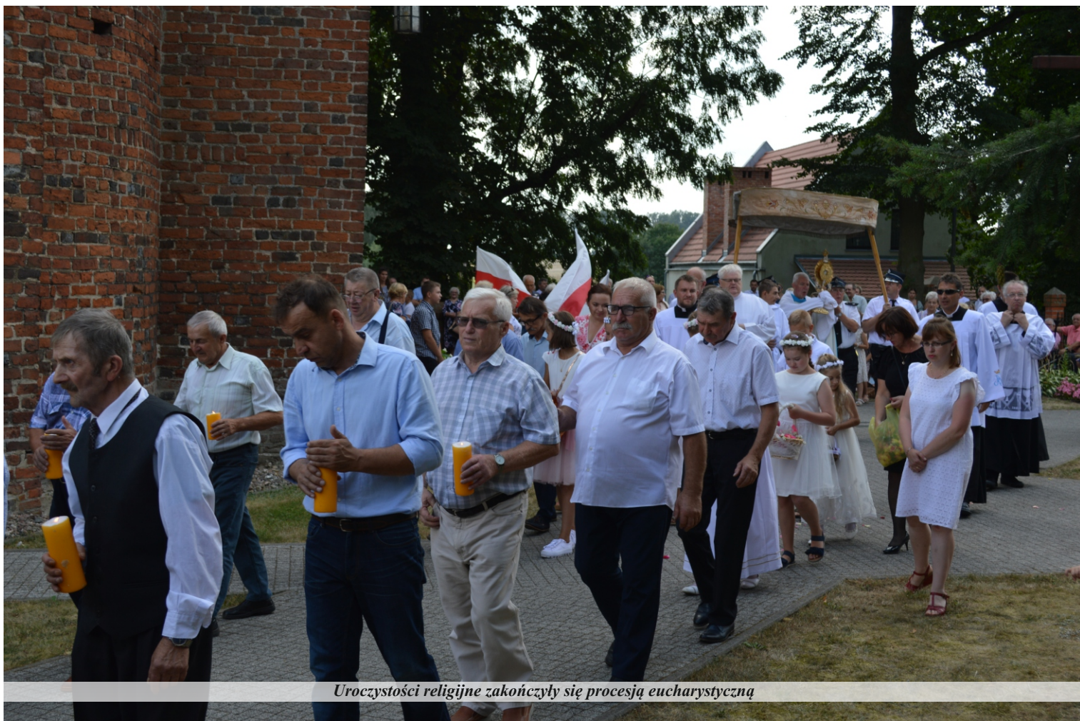
Uroczystości religijne zakończyły się procesją eucharystyczną