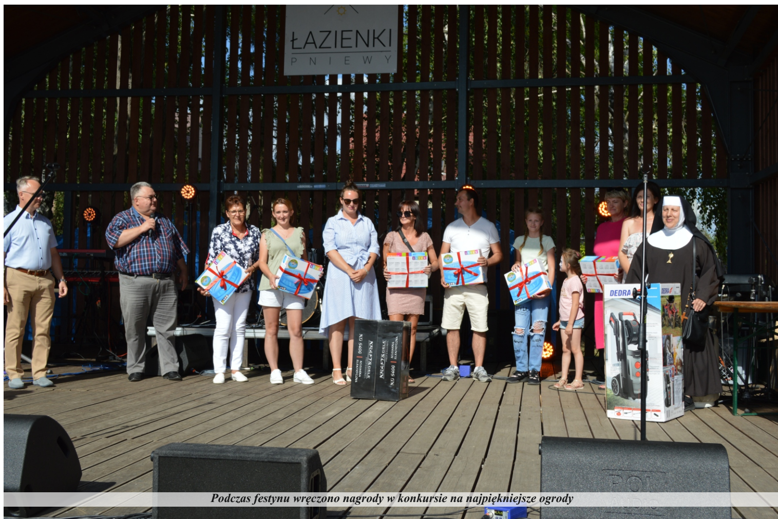
Podczas festynu wręczono nagrody w konkursie na najpiękniejsze ogrody