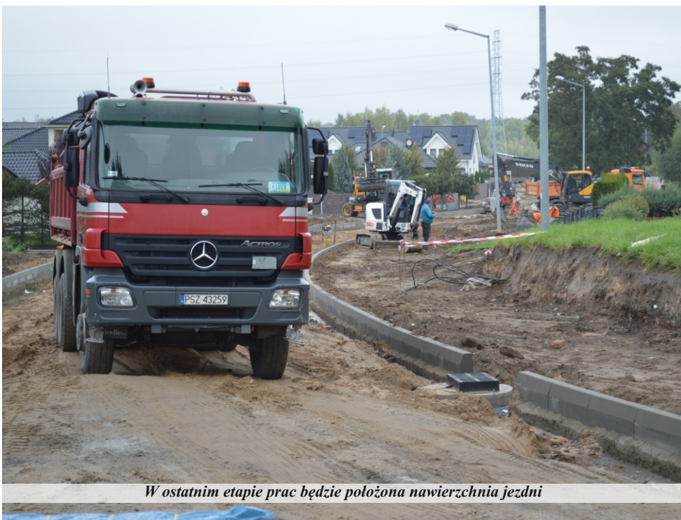
W ostatnim etapie prac będzie położona nawierzchnia jezdni

Przebudowa odcinka ul. Ks. M. Maciejewskiego realizowana jest na długości 647 metrów. Inwestycja obejmuje przede wszystkim przebudowę jezdni asfaltowej wraz z podbudową (3980 m kw), wykonanie chodników, podejść do posesji oraz peronów do przystanków autobusowych z kostki betonowej ułożonej na podbudowie, wykonanie ścieżki rowerowej, wykonanie zjazdów na posesje, wykonanie zjazdów na drogi podporządkowane z przebiegiem ścieżki rowerowej, wykonanie zjazdów na pozostałe drogi podporządkowane. W pierwszym etapie realizacji inwestycji zbudowano kanalizację deszczową