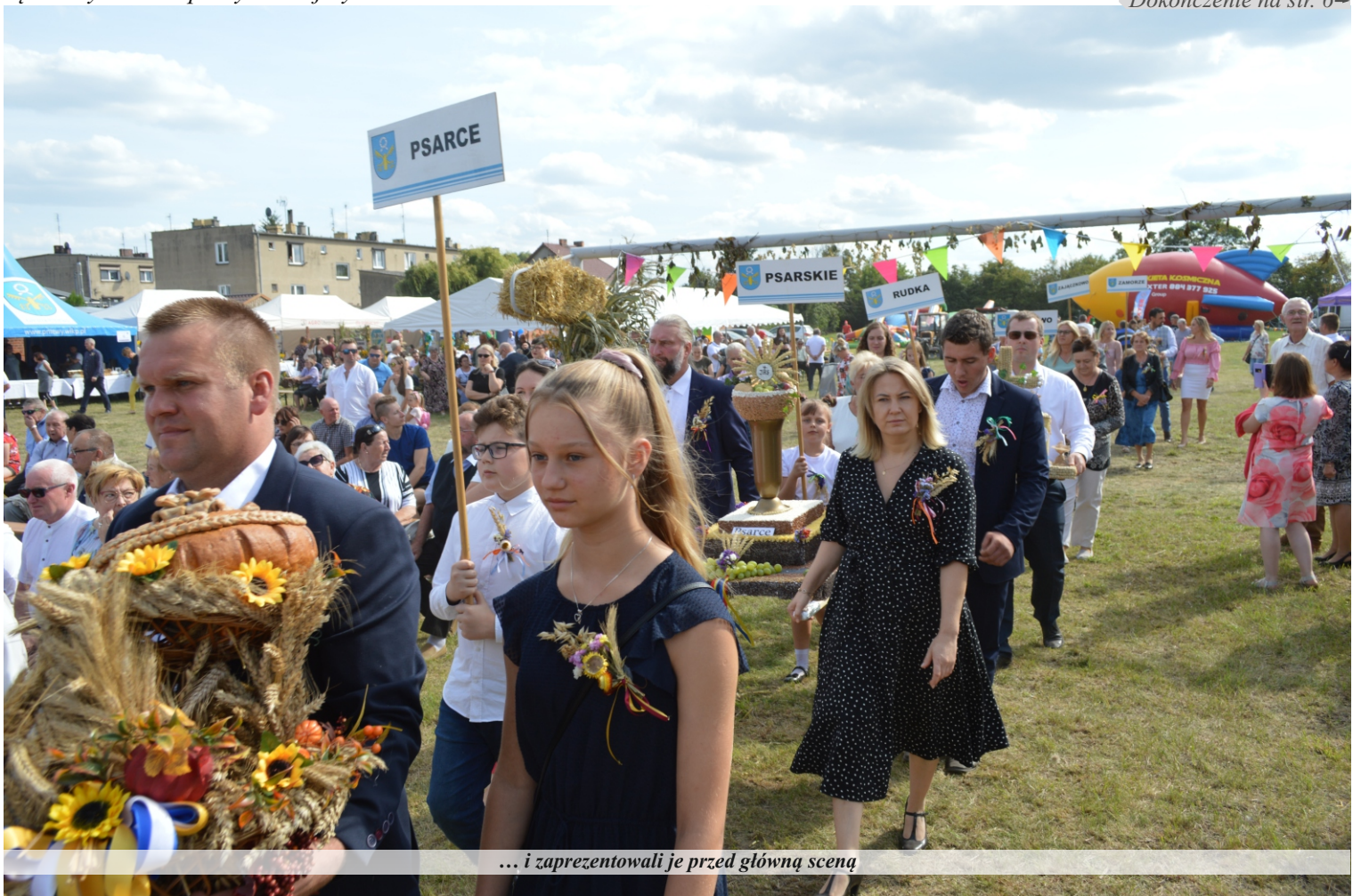
... i zaprezentowali je przed główną sceną