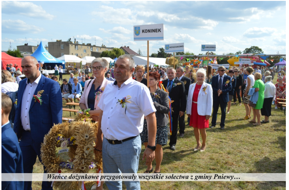
Wieniec dożynkowy przygotowali wszystkie sołectwa z gminy Pniewy...

i smakuje krwią. Dlatego Panie, dziękuję Ci za pokój na polskiej ziemi. Jedyne więcej zgody między nami by się zdało. Dziękuję rolnikom, ich kontrahentom, pracownikom pracującym na roli, dziękuję hodowcom, sadownikom i ogrodnikom. Dziękuję pszczelarzom i przepraszam was w imieniu tych, którzy niszczą wasze pasieki, zabijają opryskami pszczoły, niszczą drzewa miododajne. Chciałoby się powiedzieć: wybaczcie im, bo nie wiedzą, co czynią. Najłagodniejszym określeniem takich działań jest bezgraniczna głupota. Niewiele zawodów jest tak bardzo uzależnionych od warunków pogodowych jak rolnik, który drży o swój zasiew i o plon niemal przez cały rok, na każdym etapie. Jeżeli dzisiaj nie zadbamy o racjonalne gospodarowanie wodą, jeżeli nie zadbamy o drzewostan i wiele innych tym podobnych działań, to nasze dzieci i wnuki, a może już my, będziemy drżeli o plony. Bo zajrzy nam w