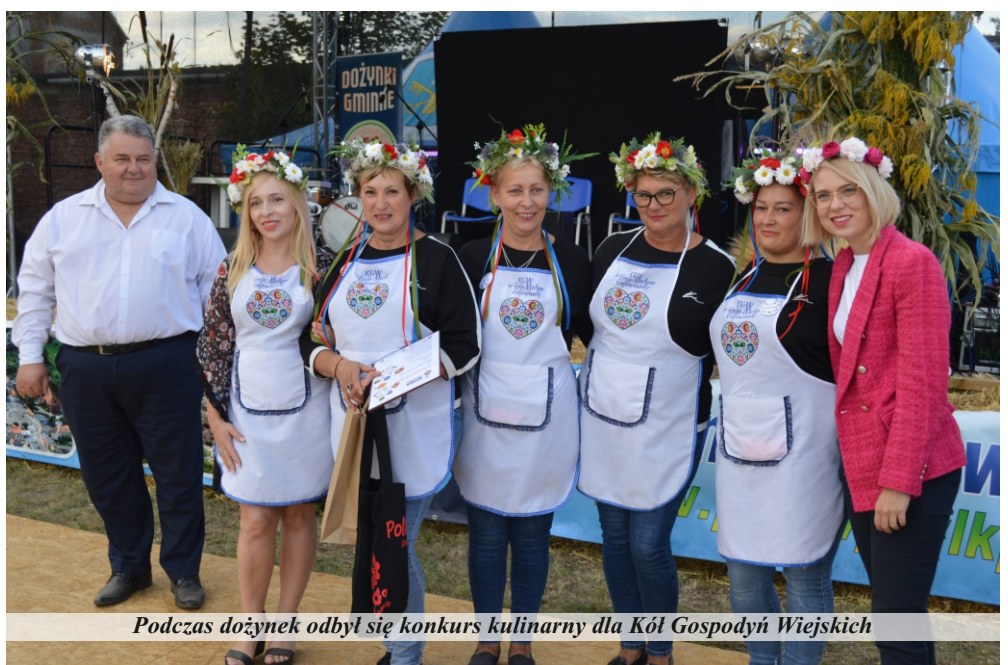
Podczas dożynek odbył się konkurs kulinarny dla Kół Gospodyń Wiejskich