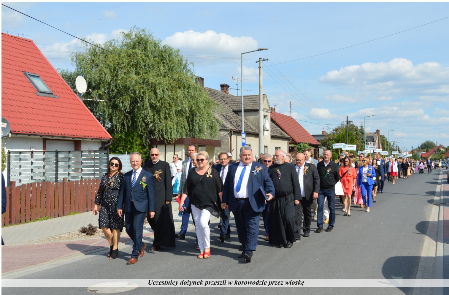
Uczestnicy dożynek przeszli w korowodzie przez wioskę