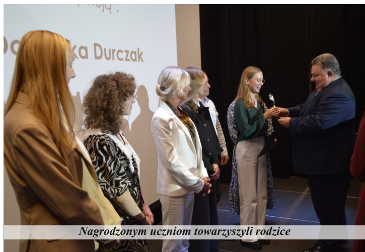
Nagrodzonym uczniom towarzyszyli rodzice

13 września uroczysto wręczono pierwsze stypendia Burmistrza Gminy Pniewy. Gala z udziałem wyróżnionych uczniów i ich rodziców odbyła się w Bibliotece Publicznej Centrum Kultury. Na ten cel z budżetu gminy przeznaczono 28.000 zł.