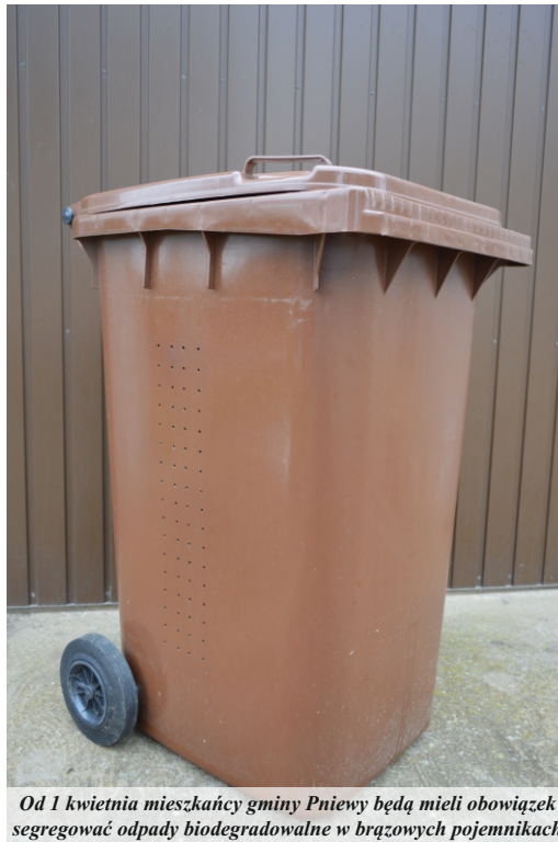
Od 1 kwietnia mieszkańcy gminy Pniewy będą mieli obowiązek segregować odpady biodegradowalne w brązowych pojemnikach

III. Następuje także zmiana stawki opłaty ryczałtowej na nieruchomości na której znajduje się domek letniskowy lub inna nieruchomość wykorzystywana na cele rekreacyjno - wypoczynkowe w wysokości 200,00 zł.