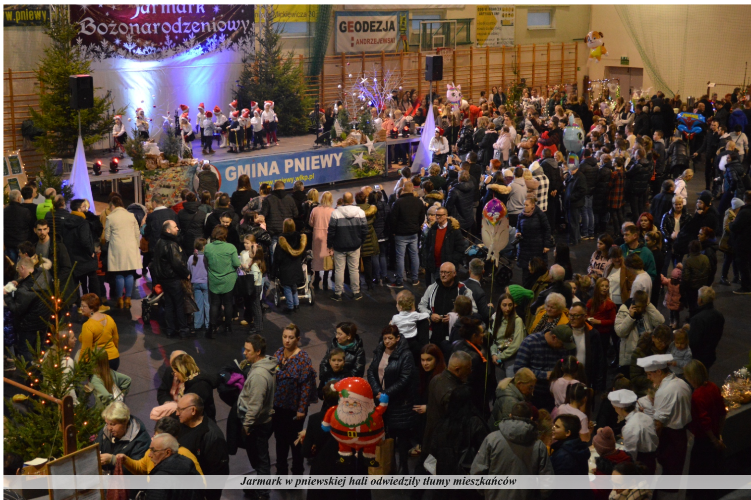
Jarmark w pniewskiej hali odwiedziły tony mieszkańców