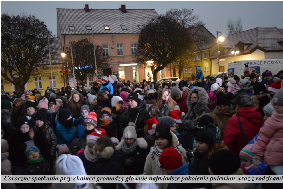
Coroczne spotkania przy choince gromadzą głównie najmłodsze pokolenie pniewian wraz z rodzicami