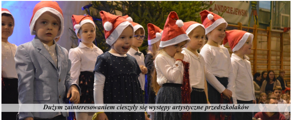
Dużym zainteresowaniem cieszyły się występy artystyczne przedszkolaków