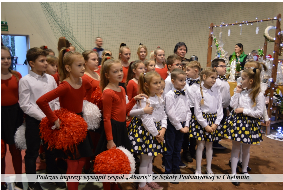
Podczas imprezy wystąpił zespół „Abaris” ze Szkoły Podstawowej w Chelmnie