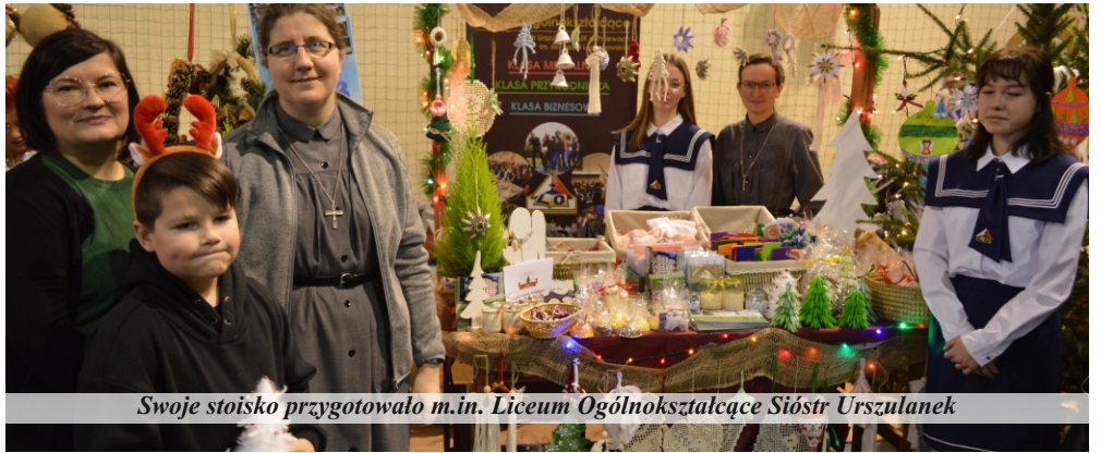
Swoje stoisko przygotowało m.in. Liceum Ogólnokształcące Sióstr Urszulanek

„Miś”, młode tancerki z grupy ARTClassica, Zespół Taneczny „Abaris” ze Szkoły Podstawowej w Chełmnie, chór dziecięco-młodzieżowy „Promyki Słoneczne”, uczniowie szkoły w Nojewie i w Chełmnie, zespoły taneczne ze szkoły pniewskiej – Flex i Twister, chór „Wrzos” z Dziennego Domu Seniora. Uczestnicy jarmarku obejrzeli także zwiastun kolejnego przedstawienia przygotowywanego przez grupę ze świetlicy pniewskiej szkoły podstawowej. Tym razem wystawiana będzie „Mulan”. Na zakończenie kilkugodzinnego jarmarku wystąpił zespół „Amor Angeli”, dokonano także podsumowania loterii fantowej.