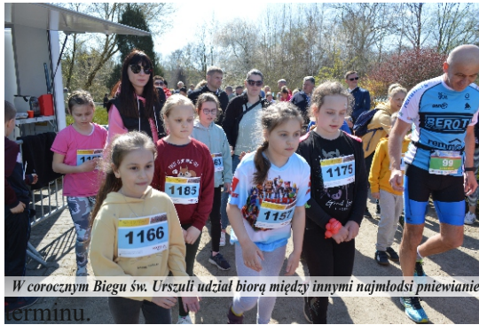
W corocznym Biegu św. Urszuli udział biorą między innymi najmłodsi pniewianie w terminu.

Coroczny bieg odbywa się dla uczczenia pamięci patronki Pniew św. Urszuli Ledóchowskiej. Po raz pierwszy przeprowadzono go w 150 rocznicę urodzin świętej, w 2015 roku. Pierwsze pięć edycji zorganizowano w Poniedziałek Wielkanocny. W to liturgiczne święto, 17 kwietnia 1865 roku przysłała na świat Julia Ledóchowska, późniejsza założycielka Zgromadzenia Sióstr Urszulanek Serca Jezusa Konającego. Pandemia koronawirusa spowodowała przeniesienie dwóch edycji (2020 i 2021) na pierwszą sobotę września. W ubiegłym roku impreza wróciła do pierwotnego