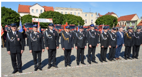
Pięć lat temu, z okazji jubileuszu OSP Pniewy, miejscowa jednostka organizowała Powiatowy Dzień Strażaka. W tym roku będzie podobnie.