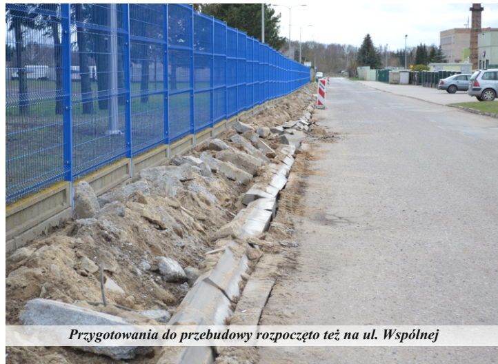
Przygotowania do przebudowy rozpoczęto też na ul. Wspólnej

Oprócz zadań realizowanych przez gminę Pniewy, na terenie miasta rozpoczęła się inwestycja, realizowana przez powiat szamotulski. Zapowiadana od lat przebudowa ul. Konińskiej ma zakończyć się do 31 lipca tego roku. Rozpoczęto już demontaż chodników. W ramach przebudowy drogi powiatowej, zmodernizowany będzie odcinek 990 metrów biejących, począwszy od skrzyżowania z ul. Poznańską. Zakres robót będzie obejmował między innymi przebudowę nawierzchni asfaltowej, remont nawierzchni chodników, zjazdów i miejsc postojowych z kostki betonowej, wykonaniu nawierzchni nowych zjazdów i chodników z kostki betonowej, poprawę odwodnienia drogi w zakresie wymiany istniejących wpustów deszczowych oraz wykonanie dodatkowych wpustów wraz z ich podłączeniem do istniejącej kanalizacji deszczowej. Koszt zadania wyniesie 4.198.053,73 zł, z czego 95 procent będzie pokrywał Rządowy Fundusz Polski Ład.