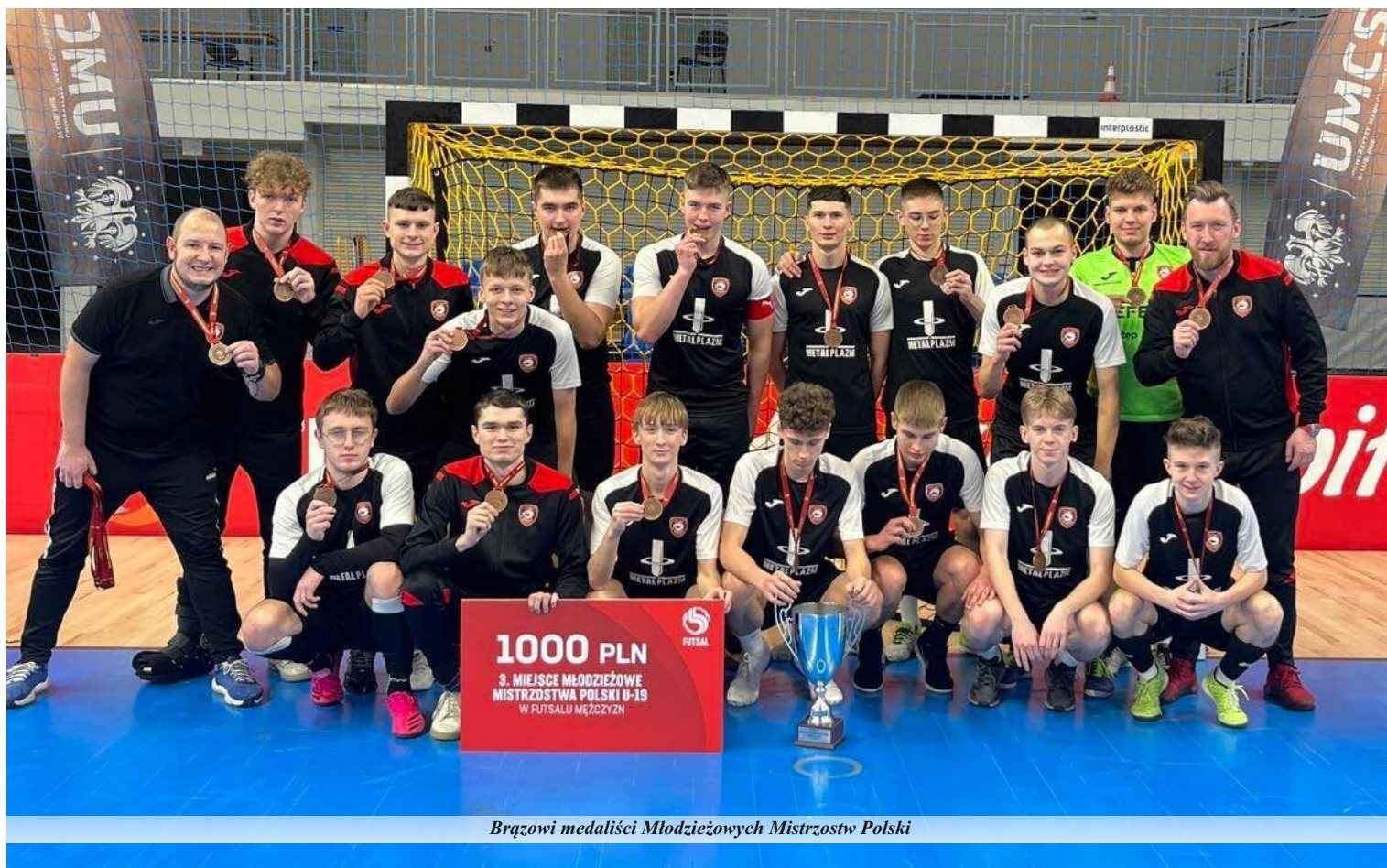
Brązowi medaliści Młodzieżowych Mistrzostw Polski

Red Dragons od początku swojej działalności, którą prowadzi już od kilkunastu lat, stawia na wychowanków. Na bazie miejscowych zawodników stworzono klub, który awansował do Ekstraklasy Futsal i przez wiele sezonów na tym najwyższym poziomie sobie nieźle radzi. Ale to nie wszystko. Klub nie żyje dniem dzisiejszym i wie, że kiedy karierę zakończą obecni gracze, w ich miejsce muszą wejść następcy. Szkoli przyszłych zawodników od najmłodszych lat. Co jakiś czas można sprawdzić, czy szkolenie idzie w dobrym kierunku. Jednym z takich egzaminów są zawody na najwyższym szczeblu krajowym. I w takich pniewianie uczestniczą. Efekty czasami bywają nadspodziewane i zdumiewające.