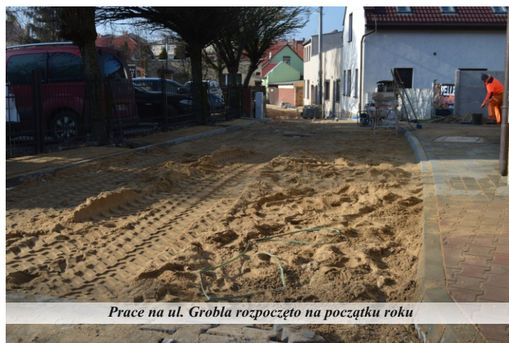
Prace na ul. Grobla rozpoczęto na początku roku

W pierwszym kwartale 2023 roku trwały prace na pięciu pniewskich ulicach, w ramach czterech zadań. Trzy zadania realizuje gmina Pniewy, jedno powiat szamotulski. Na wszystkie realizowane inwestycje drogowe, zarówno samorząd gminny jak i powiatowy otrzymały znaczące wsparcie finansowe z Rządowego Funduszu Polski Ład: Program Inwestycji Strategicznych.