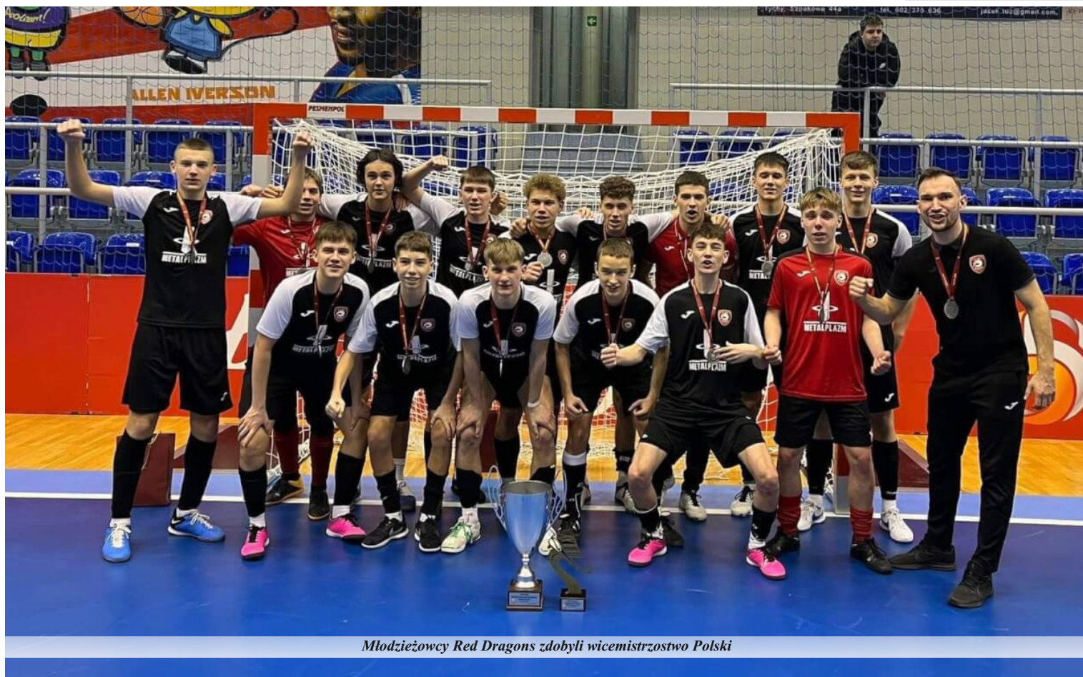
Młodzieżowcy Red Dragons zdobyli wicemistrzostwo Polski