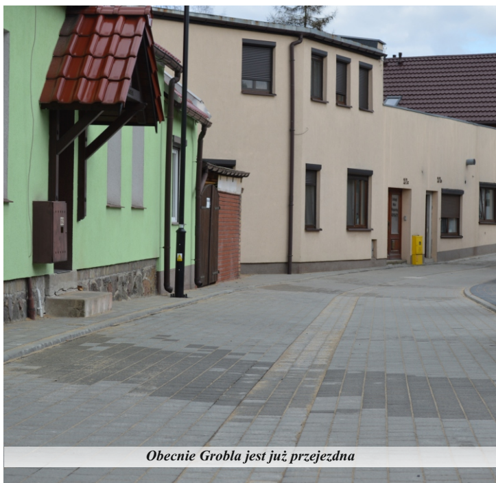
Obecnie Grobla jest już przejezdna

„Przebudowa układu komunikacyjnego w Pniewach” obejmowała budowę fragmentu ulicy Tęczowej, przebudowę ulic: Spacerowej, Grobla i Powstańców Wielkopolskich. Prace na Tęczowej i Spacerowej zakończono w roku 2022. Ulica Grobla została ukończona w marcu. Do końca maja ma być gotowa ostatnia z wymienionych ulic – Powstańców Wielkopolskich. Każda z trzech ukończonych już ulic ma inną nawierzchnię. Tęczową wykonano z tradycyjnej kostki pozbrukowej, na Spacerowej zastosowano nawierzchnię bitumiczną, z kolei na Grobla – kostkę brukową typu starobruk. W zakres prac na ul. Grobla