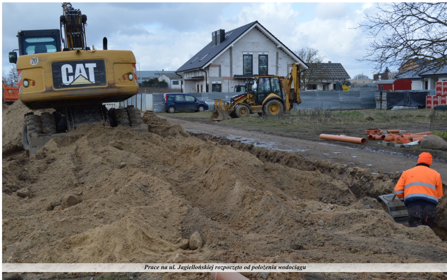
Prace na ul. Jagiellońskiej rozpoczęto od położenia wodociągu