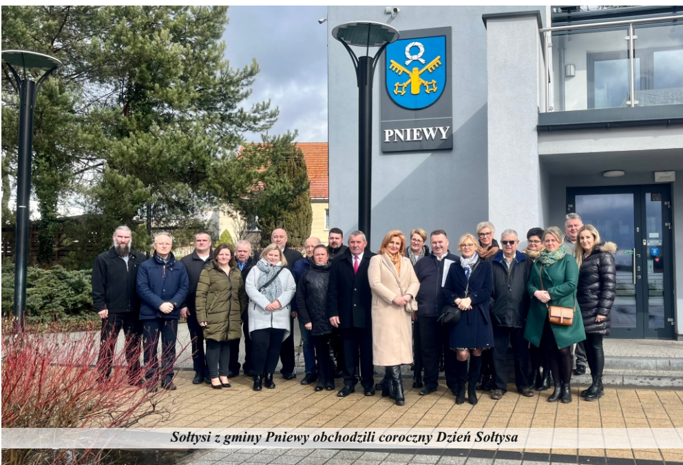
Sołtysi z gminy Pniewy obchodzili coroczny Dzień Sołtysa