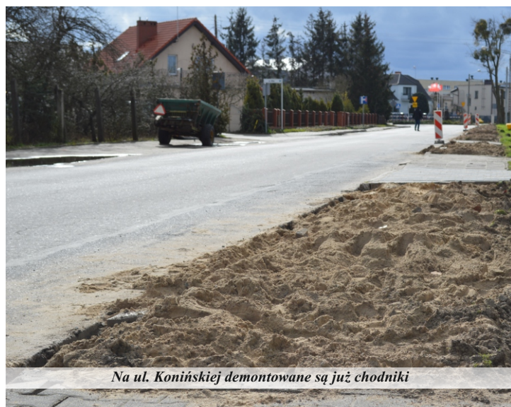
Na ul. Konińskiej demontowane są już chodniki