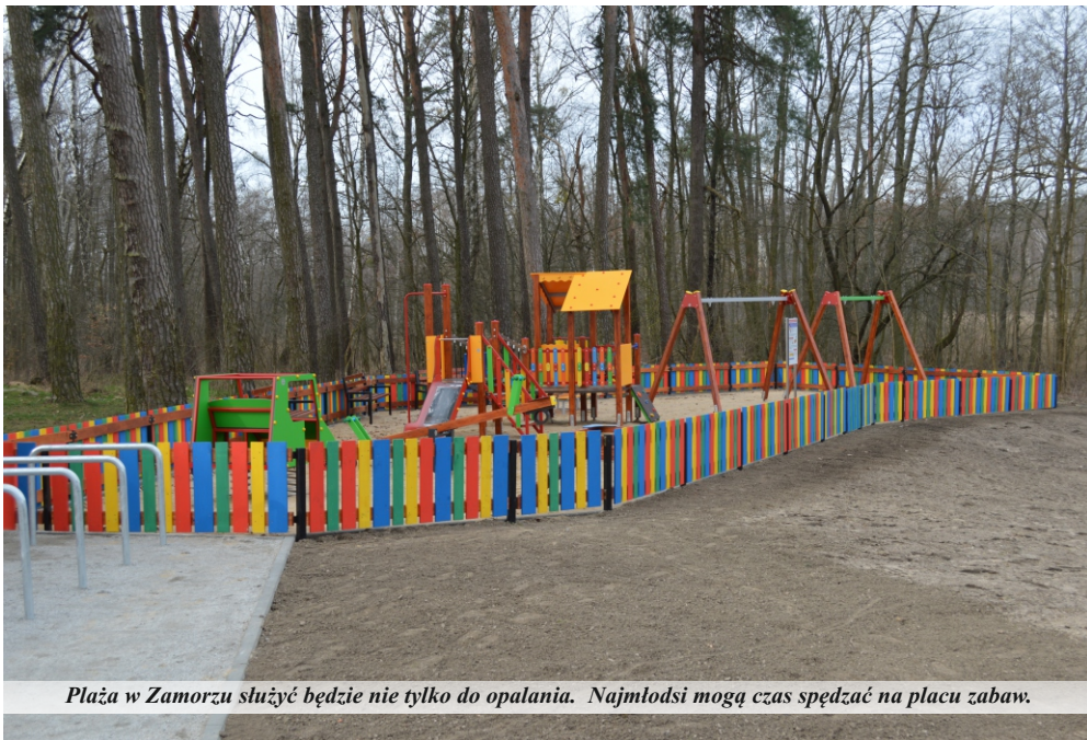
Plaża w Zamorzu służyć będzie nie tylko do opalania. Najmłodzi mogą czas spędzać na placu zabaw.

z podkładów kolejowych. W strefie wejścia utwardzono nawierzchnię na powierzchni 83 m kw. Do dyspozycji przebywających na plaży będą dwie przebieralnie z drewna sosnowego, impregnowane i malowane. Dla rowerzystów przygotowano stojaki na rowery w ilości 8 sztuk.