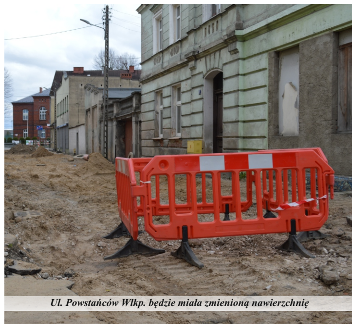
Ul. Powstańców Wlkp. będzie miała zmienioną nawierzchnię