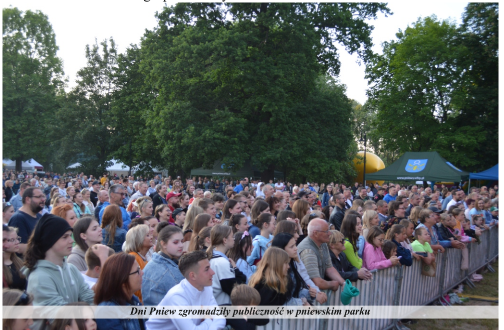
Dni Pniew zgromadziły publiczność w pniewskim parku

Głównym wydarzeniem sobotniego wieczoru był koncert Viki Gabor. Młoda artystka, o której Polska i Europa usłyszała w 2019 roku, kiedy zwyciężyła w 17. Konkursie Piosenki Eurowizji dla Dzieci. W latach 2020 i 2022 wydała dwa albumy studyjne. Pierwszy dzień świętowania zakończyła impreza klubowa House Night. W godzinach nocnych przy dźwiękach saksofonu na żywo pojawił się SztabaSax.