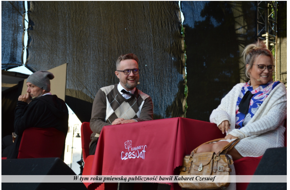
W tym roku pniewską publiczność bawił Kabaret Czesuaf