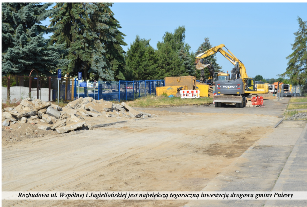
Rozbudowa ul. Wspólnej i Jagiellońskiej jest największą tegoroczną inwestycją drogową gminy Pniewy

Boom inwestycyjny na terenie miasta spowodowany jest nie tylko