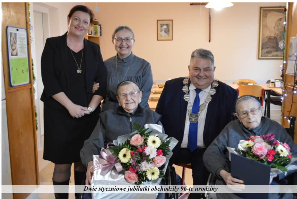
Dwie styczniowe jubilatki obchodziły 96-te urodziny