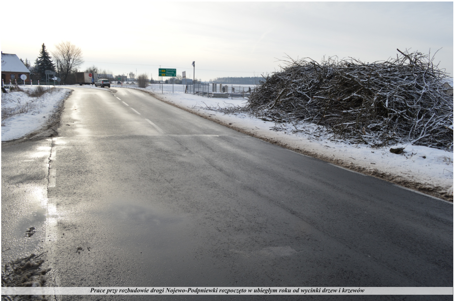
Prace przy rozbudowie drogi Nojewo-Podpniewki rozpoczęto w ubiegłym roku od wycinki drzew i krzewów

zastępca Józef Ćwiertnia wielokrotnie prosili mieszkańców od powstrzymania się przed sprzedażą lub podziałem nieruchomości przyległych do drogi, co powodowałoby opóźnienie procesu przygotowania dokumentacji. Dzięki temu projekt jest już gotowy, a z Urzędu Marszałka Województwa Wielkopolskiego popłynął jasny sygnał do uruchomienia inwestycji. Decyzja o zezwoleniu na realizację inwestycji drogowej polegającej na rozbudowie drogi wojewódzkiej nr 116, realizowanej w ramach inwestycji pn. „Rozbudowa drogi wojewódzkiej nr 116 Nojewo-Podpniewki na odcinku od Nojewa do skrzyżowania z drogą wojewódzką nr 187” została wydana przez wojewodę wielkopolskiego 15 marca 2023 roku i nadano jej rygor natychmiastowej wykonalności.