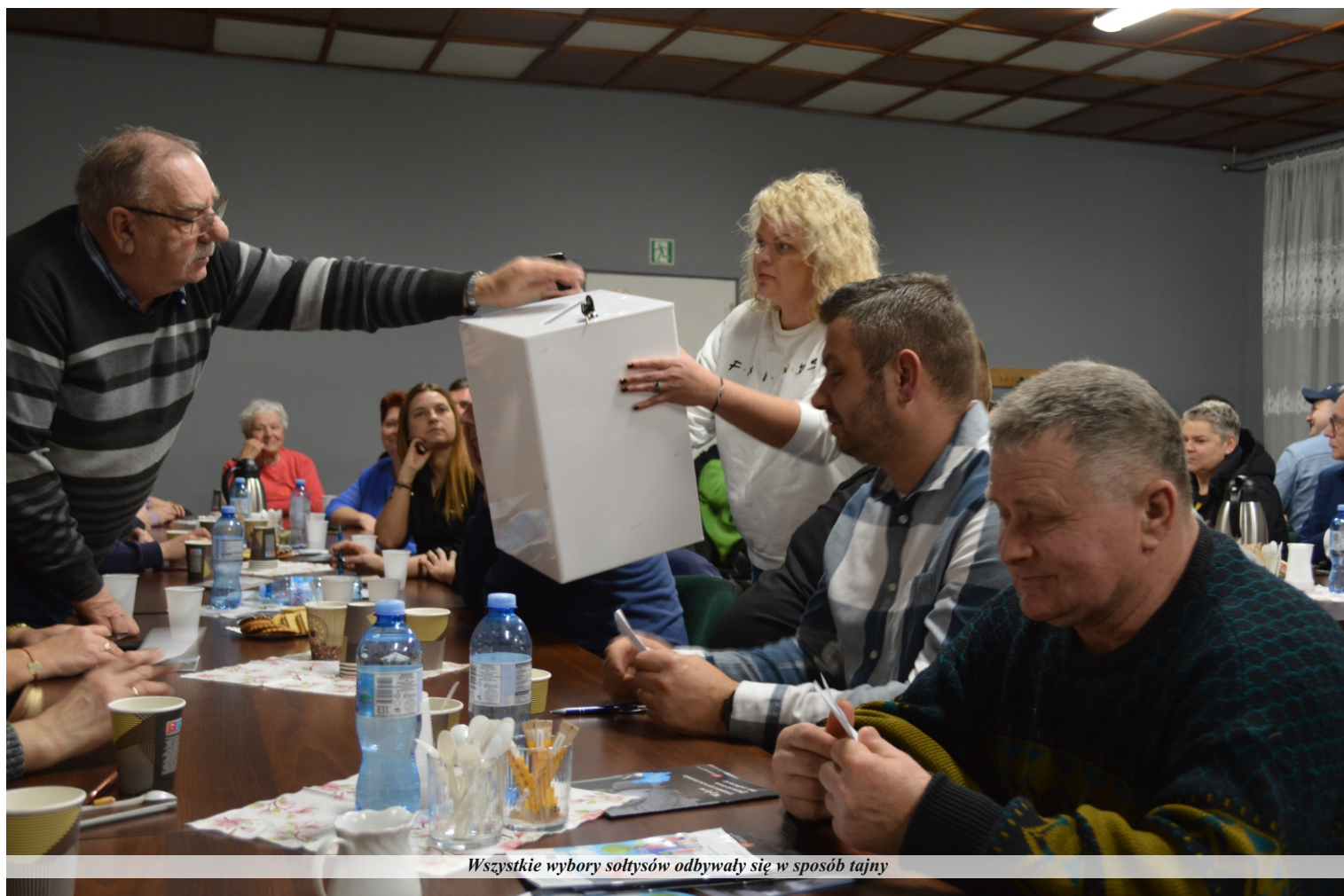
Wszystkie wybory sołtysów odbywały się w sposób tajny