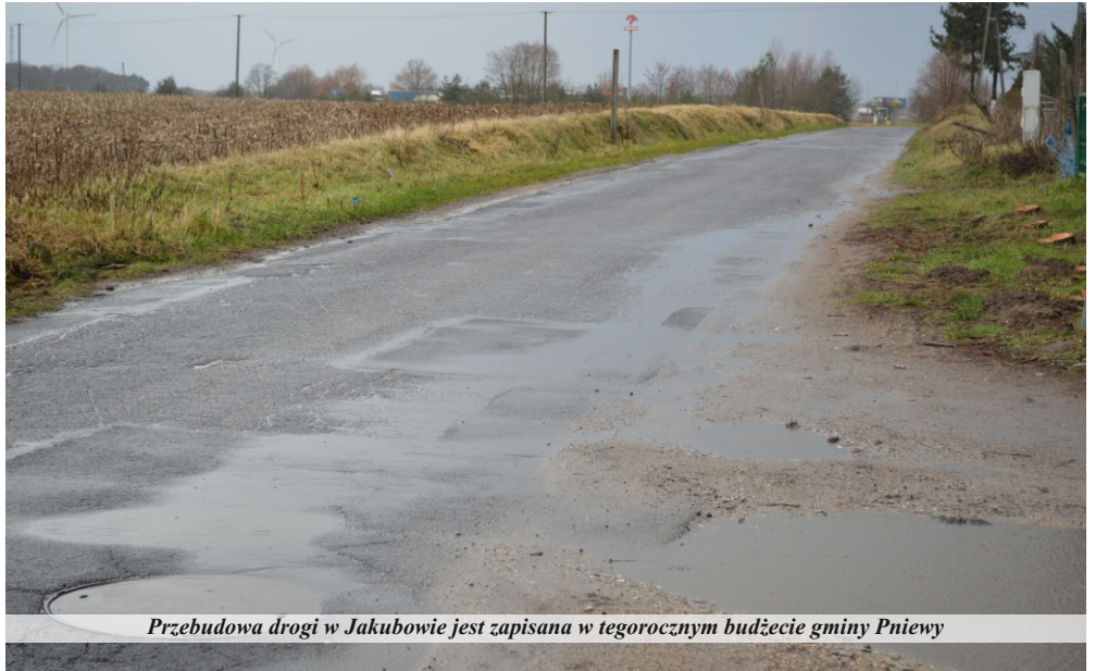
Przebudowa drogi w Jakubowie jest zapisana w tegorocznym budżecie gminy Pniewy

Gmina Pniewy złożyła wniosek na zadanie pod nazwą: „Modernizacja układu drogowego w Lubocześnicy poprzez remont dróg gminnych nr 266515P i 266523P”. – W 2022 roku złożyłem do budżetu gminy propozycję modernizacji dróg w Lubocześnicy.