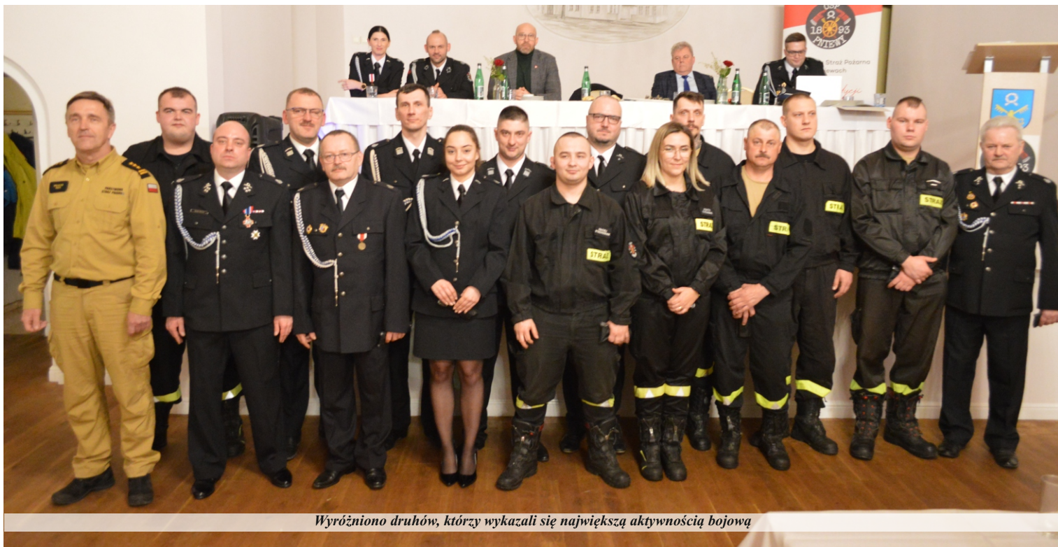
Wyróżniono druhowów, którzy wykazali się największą aktywnością bojową