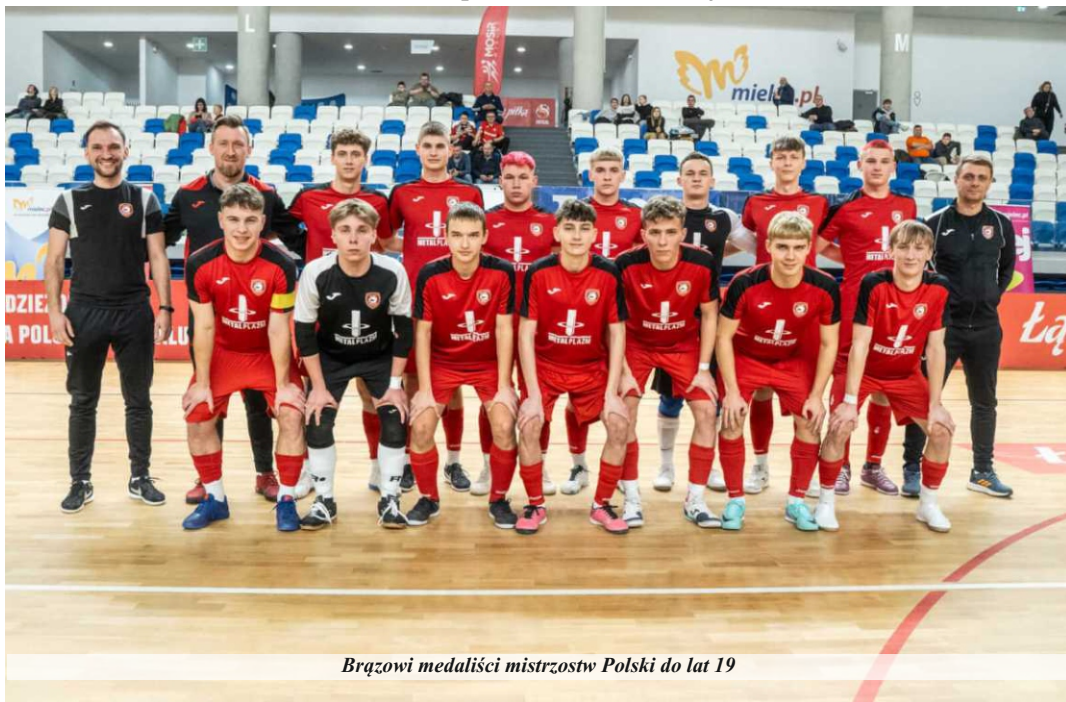
Brązowi medalści mistrzostw Polski do lat 19