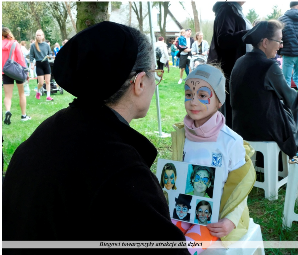
Biegowi towarzyszyły atrakcje dla dzieci