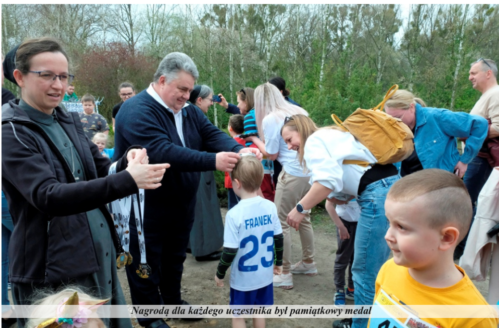
Nagrodą dla każdego uczestnika był pamiątkowy medal