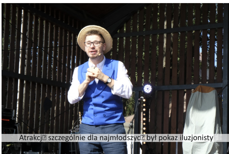
Atrakcją szczególnie dla najmłodszych był pokaz iluzjonisty