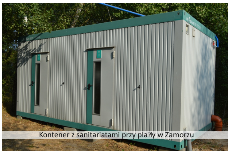
Kontener z sanitariatami przy plaży w Zamorzu

W zakończonym już sezonie kąpielowym mieszkańcy gminy Pniewy mieli do możliwość korzystania z trzech kąpielisk, strzeżonych przez Wodne Ochotnicze Pogotowie Ratunkowe. Bezpiecznie było na plażach w Pniewach, Zamorzu i Zajączkowie. W sezonie nie odnotowano żadnych poważnych zdarzeń z udziałem kąpielących się i wypoczywających na kąpieliskach.