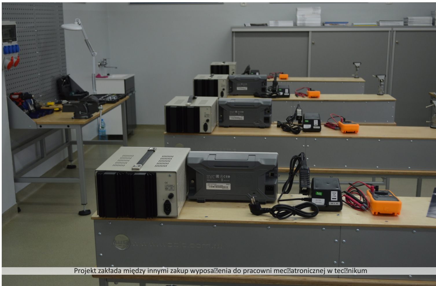
Projekt zakłada między innymi zakup wyposażenia do pracowni mechatronicznej w technikum

poprawa jakości kształcenia zawodowego, poprzez zakup nowoczesnych narzędzi, maszyn i sprzętu; podniesienie standardów, bezpieczeństwa i komfortu uczniów, poprzez zakup nowoczesnego wyposażenia; zwiększenie efektywności edukacji, poprzez realizację praktycznych szkoleń dla kadry, zgodnymi z standardami branżowymi; lepsze przygotowanie uczniów do realnych wyzwań zawodowych, poprzez doposażenie pracowni