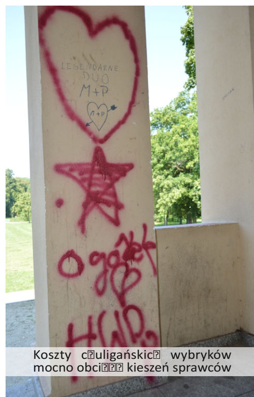
Koszty cęuligańskicę wybrków mocno obcięę kieszeń sprawców

Pałac, w którym mieści się Liceum Ogólnokształcące był w ostatnich latach modernizowany, głównie od strony zewnętrznej. W jego renowację wyłożono miliony złotych zarówno z budżetu gminy, jak i ze środków zewnętrznych. Przez lata budynek nie był chlubą miasta, toteż decyzja o jego gruntownym remoncie spotkała się uznaniem pniewian.