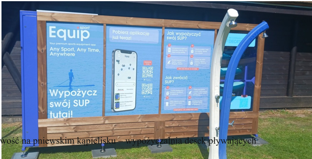
Nowość na pniewskim kąpielisku – wypożyczalnia desek pływających

Mobilna wypożyczalnia tego rodzaju sprzętu powstała w Łazienkach Miejskich w miesiącu sierpniu. Będzie można z niej korzystać do końca października w godz. od 11.00 do zmierzchu. Warunkiem koniecznym do wypożyczenia sprzętu jest zainstalowanie na smartfonie aplikacji. Pobrać ją