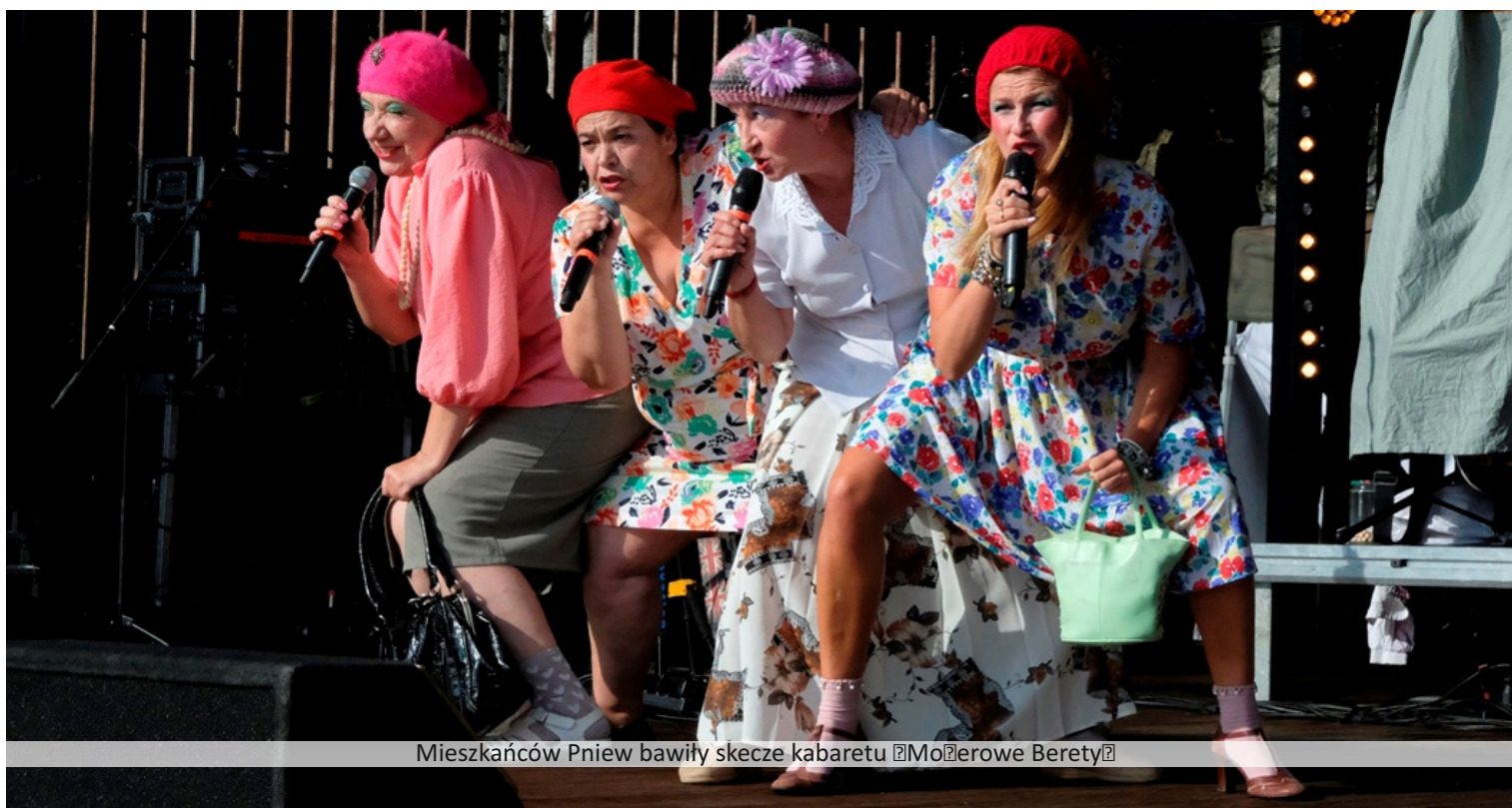
Mieszkańców Pniew bawiły skecze kabaretu „Moherowe Berety”

Druga niedziela sierpnia to od lat termin zarezerwowany na Jarmark św. Wawrzyńca. Pniewianie spotkali się nad Jeziorem Pniewskim w godzinach popołudniowych, w niedzielę 11 sierpnia.