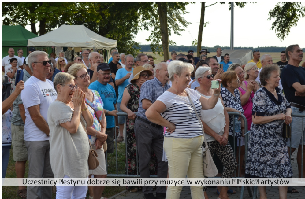
Uczestnicy festynu dobrze się bawili przy muzyce w wykonaniu śląskich artystów