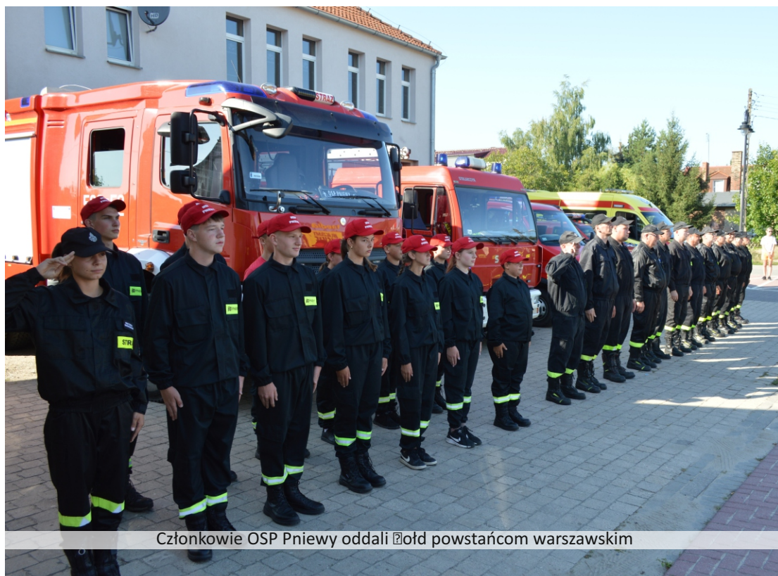
Członkowie OSP Pniewy oddali hołd powstańcom warszawskim

1 sierpnia 1944 r. o godz. 17.00. Było największą akcją zbrojną podziemia w okupowanej przez Niemców Europie i największym zrywem niepodległościowym na terenie okupowanej Polski. Do walki w stolicy przystąpiło około 40-50 tys. powstańców. Planowane na kilka dni, trwało ponad dwa miesiące. W czasie walk w Warszawie zginęło około 18 tys. powstańców, 25 tys. zostało rannych. Straty wśród ludności cywilnej wynosiły około 180 tys. zabitych.