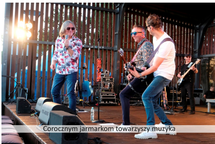
Corocznym jarmarkom towarzyszy muzyka