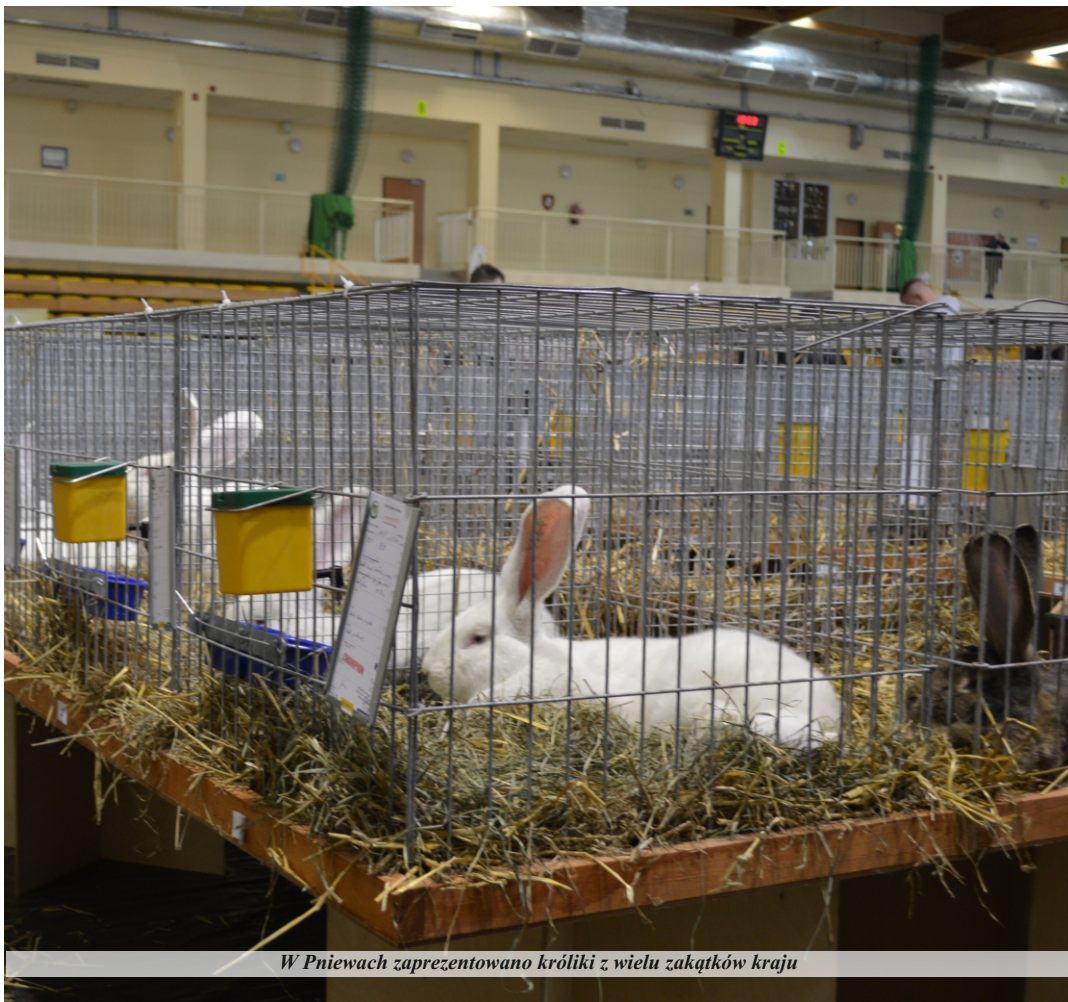
W Pniewach zaprezentowano króliki z wielu zakątków kraju

Od kilku lat, w miesiącach jesiennych gmina Pniewy jest gospodarzem krajowej wystawy królików. Organizatorem imprezy jest Krajowy Związek Hodowców Królików.