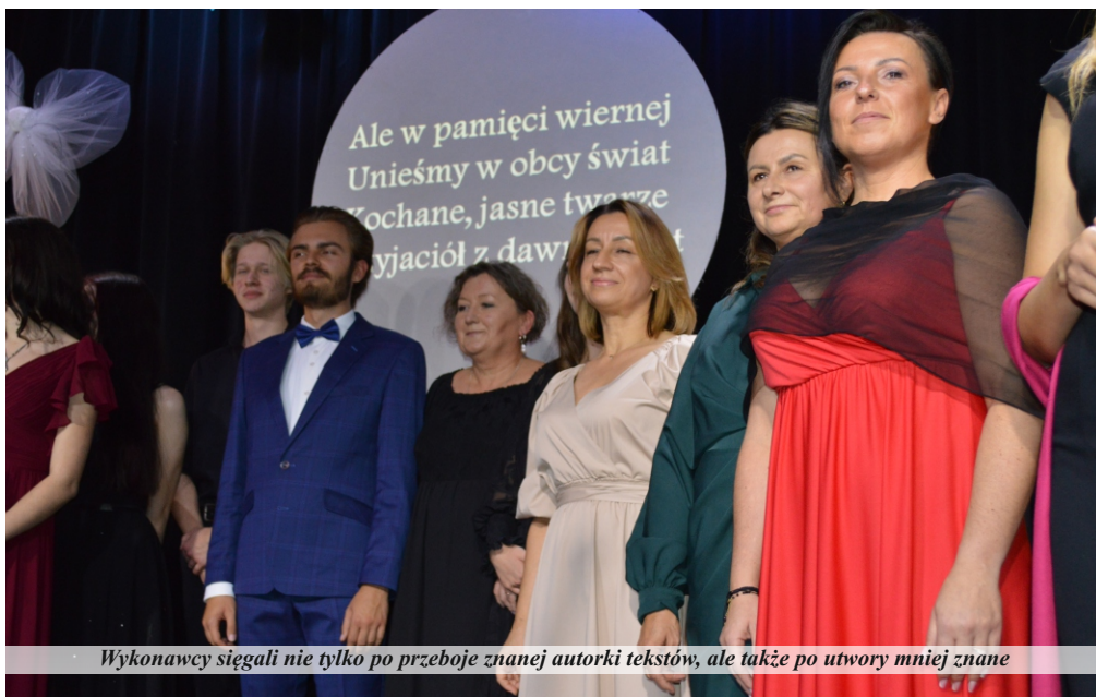
Wykonawcy sięgali nie tylko po przeboje znanej autorki tekstów, ale także po utwory mniej znane