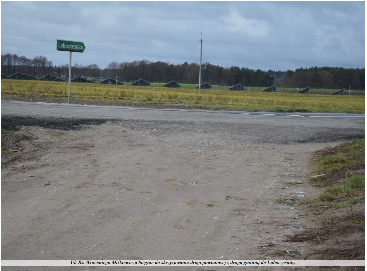
Ul. Ks. Wincentego Miśkiewicza biegnie do skrzyżowania drogi powiatowej z drogą gminną do Lubocześnicy