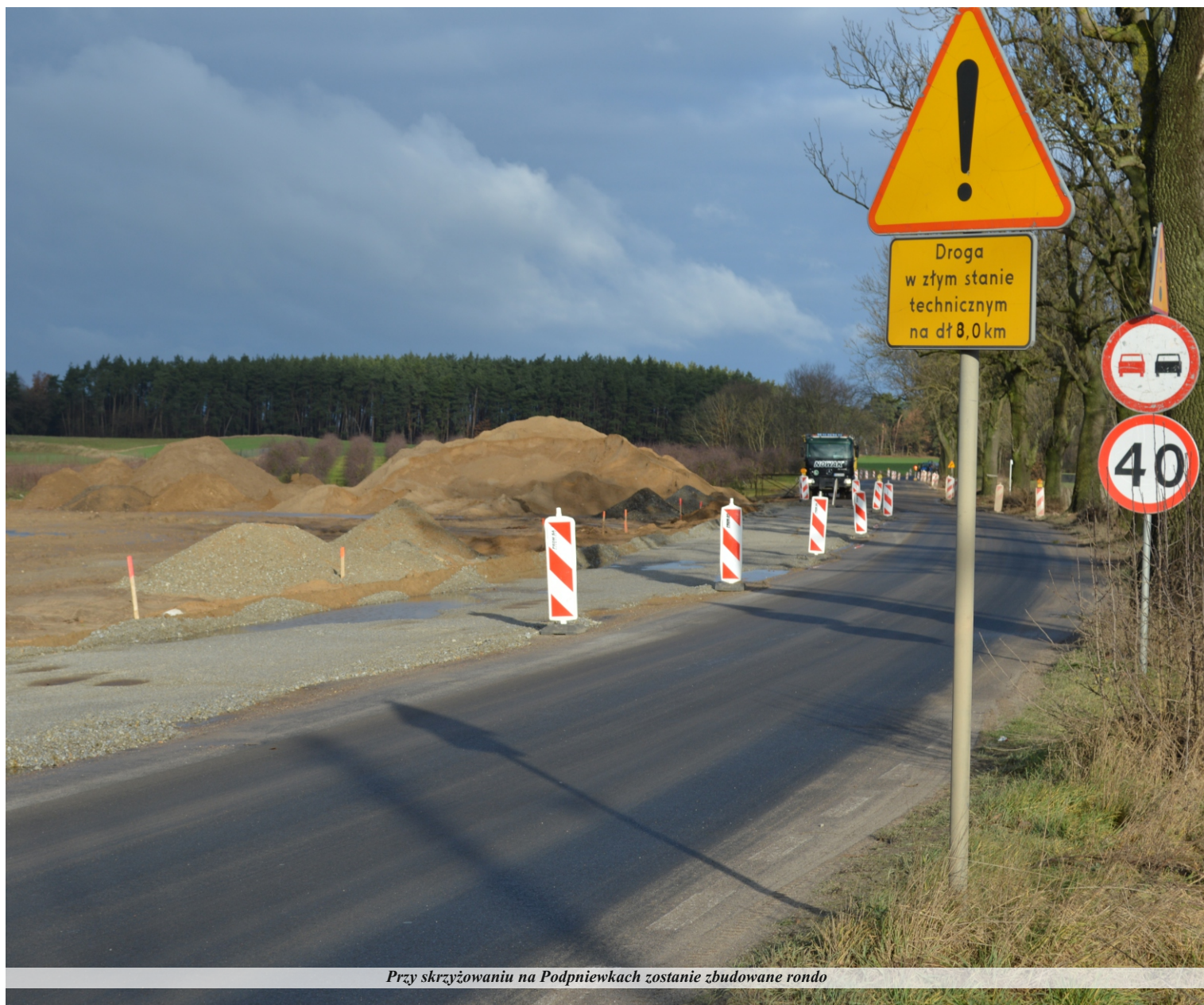
Przy skrzyżowaniu na Podpniewkach zostanie zbudowane rondo

włącza się za pomocą skrzyżowania w drogę wojewódzką nr 187. W miejscu skrzyżowania wybudowane zostanie rondo o średnicy zewnętrznej 45 m. Po zrealizowaniu inwestycji zostanie zwiększona nośność drogi. W ramach prac budowlanych zaplanowano między innymi budowę i przebudowę nawierzchni drogi wojewódzkiej, budowę i przebudowę skrzyżowań z istniejącą siecią drogową, budowę i przebudowę zjazdów indywidualnych i publicznych, budowę zatok autobusowych, budowę chodników (na wybranych odcinkach), budowę ścieżek rowerowych (na wybranych odcinkach), budowę poboczy gruntowych, budowę skarp z humusowaniem i odsianiem trawą, budowę murów oporowych, budowę i przebudowę przydrożnych rowów drogowych, budowę i przebudowę przepustów pod drogami, budowę i przebudowę zaruowań pod zjazdami, przebudowę i zabezpieczenie kolidujących urządzeń infrastruktury technicznej, budowę elementów bezpieczeństwa ruchu, budowę kanalizacji deszczowej.