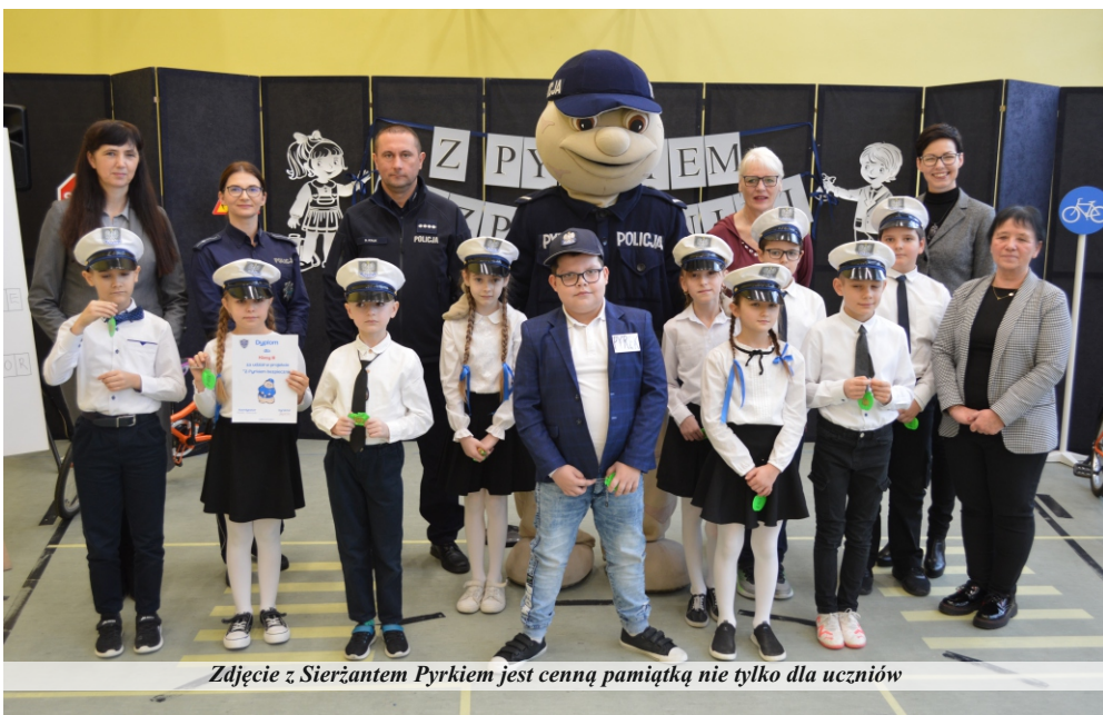
Zdjęcie z Sierżantem Pyrkiem jest cenną pamiątką nie tylko dla uczniów