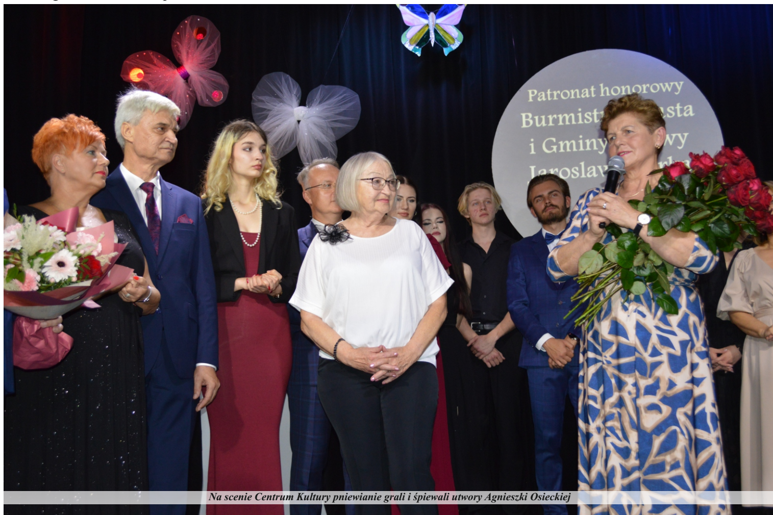
Na scenie Centrum Kultury pniewianie grali i śpiewali utwory Agnieszki Osieckiej